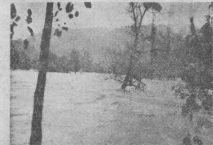
Dravinja je drla po dolini kot močerna reka

druge reševalne skupine. To se je tudi zgodilo. Na Rogozniški cesti je bila potrebna pomoč, desno izpod železniskega mostu, v Budini itd. Stab je bil celo noč pripravljen in tudi gasilci. Na spanje ni bilo časa misliti. Telefonika sporočila niso bila razveseljiva. Vrsta so se opozorila in obvestila.