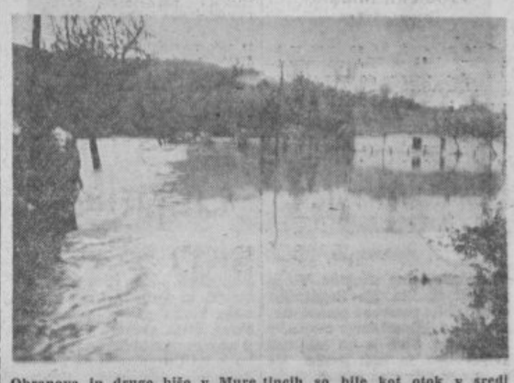
Obranova in druge hiše v Muretineh so bile kot otok v sredi velikega jezera

v vodi. Pri Obranovi hiši je bila voda do oken, pri hiši za njo pa še višje. Vaščani so rešili, kar se je rešiti dalo. Najtežje je bilo z ljudmi. Da zadnjega jih ni bilo mogoče dobiti od hiš. Tesen požiralnik pri mostu pred Horvatovo hišo je komaj požiral ogromne količine vode, ki je potem drla čez dvorišče naprej mimo Male vasi in Gajevec proti Forminu. V Gajevcih pri hiši št.1 ni bilo mogoče dalje po cesti. Vse je že bilo v vodi.