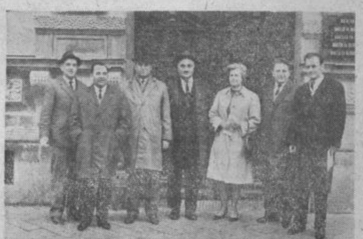
Predsedniki okrajev in občin iz SR Srbije na obisku v Ptuj.

V torek, 27. 10. 1964, so obiskali Ptuj predsedniki okrajev oziroma občin Čačak, Kraljevo, Kruševac, Smederevo in iz drugih občin, ki so bili na 3-dnevnem obisku v Mariboru in Celju na povabilo Okrajnega odbora SZDL Maribor in Celje ter »Večera« Maribor, v spomin na čase, ko so nemški fašisti precejšnje zavedne Slovence na ozemlje Srbije in sosedne Hrvaške in ko so jih tamkajšnji rodojlubi kljub lastnim vojnim težavam in nevarnostim prisrčno sprejeli pod svojo streho. Nad 30 predsednikov okrajnih in občinskih skupščin iz SR Srbije, predstavniki Beograda in družbenopolitičnih delavcev iz SR Srbije so sprejeli v nedeljo, 25. 11. v Mariboru gostitelji in predsedniki občinskih skupščin iz mariborskega in celjskega okraja.