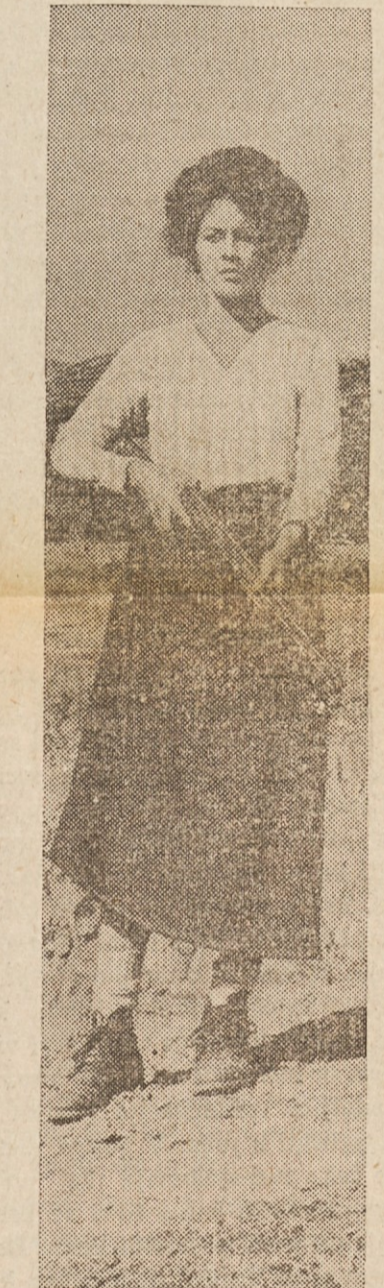
NA STRAZI! — Faye Dunaway se je postavila kot moderna amakonka na stražo pred svojim petrolejskim vrelcem v filmu "Oklahoma Crude", ki ga pripravljajo za predvajanje.

"Usmilite se, gospodar," je odvrnil tujec, "in pomagajte nam v nesreči. Nedaleč od tu, za vašo bajto, so se nam polomile sani, pa jih še popraviti ne moremo, ker so nam hudobni ljudje ponoči ukradli sekiro iz koša."