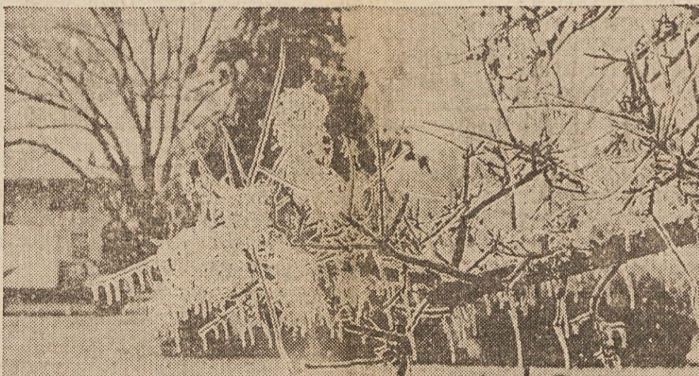
ZIMSKA LEPOTA NI VEDNO PRIJETNA — Na zgornji sliki vidimo prirodo v blešče- čih zimski obleki, na spodnji pa velik tovornjak, ki je v snegu zapeljal s ceste v jarek in ga spravljajo nazaj na trdno pot.

WASHINGTON, D.C. — Prihodnji teden pride sem na uradni obisk jordanijski kralj Hussein, ki bi rad pridobil predsednika Nixna za nov napor za pomiritev Srednjega vzhoda.