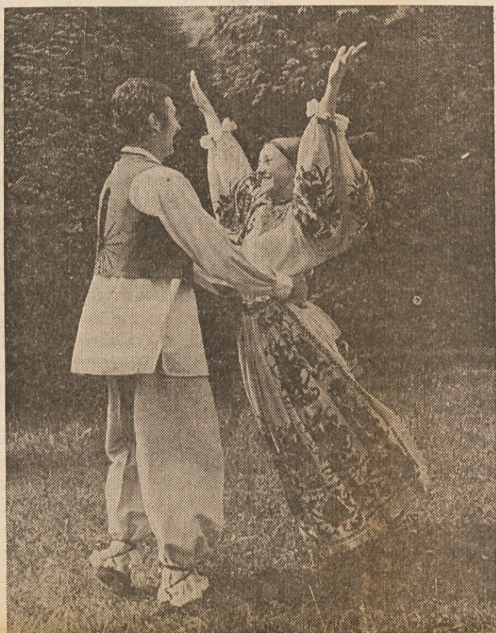
Plesalca Folklorno-plesne skupine "France Marolt"

Pevci in plesalci ljubljanske univerze bodo prihodnje nedeljo nastopili v Chicagu