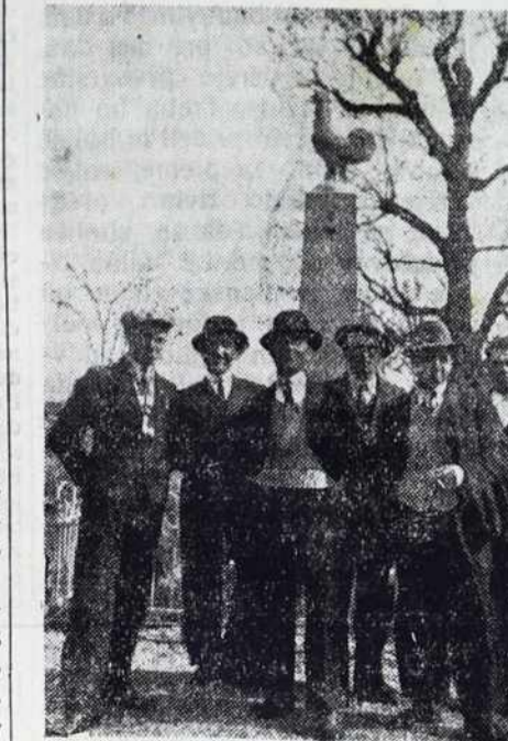
Naši v Franciji pri stebri francozkoga kokota (le coq gaulois)