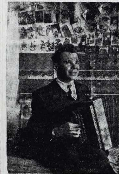
Naš harmonikaš v Franciji.