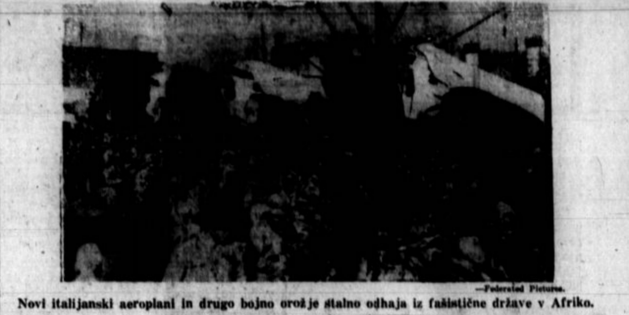
Novi italijanski aeroplani in drugo bojno orožje stalno odhaja iz fašistične države v Afriko.