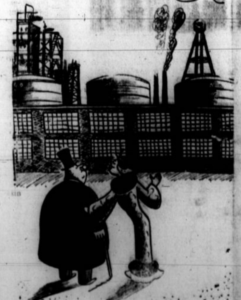
Vrhnja skorja ameriške družbe. (Narisa Redfield.)

Razume se, da se je sorazmerno zmanjšala tudi obveznost društva. Podlaga je ostala zdrava. Društvo si je valed tega med našimi rojaki in tudi med