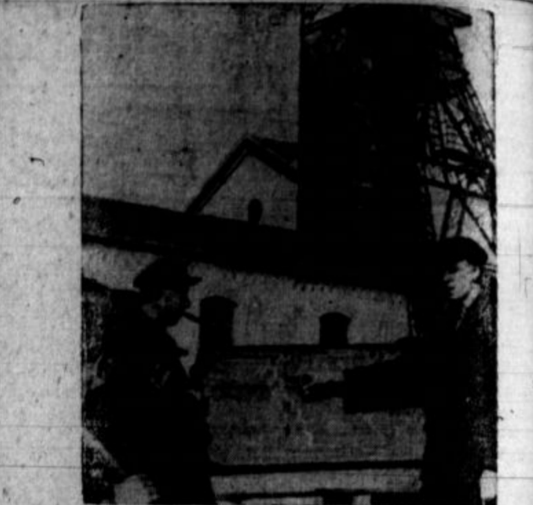
Aleksij Stakhanov, sovjetski rudar, govori tovarišem o svojem novem sistemu, ki je povečal produkcijo premoga.

— Papa, kje pa je prav za prav ta Abesinija? — Nekje med Anglijo in Italijo.