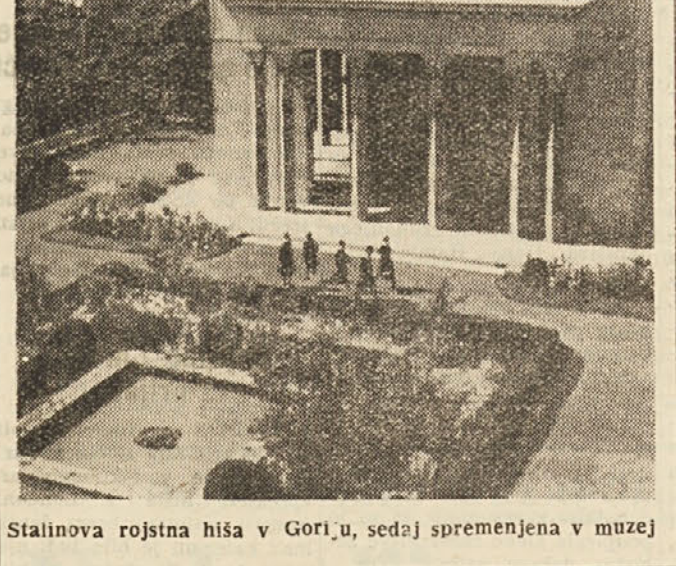
Stalinova rojstna hiša v Gori, u, sedaj spremenjena v muzej

Družbeni zakoni so objektivni in neodvisni od človeške volje, prav tako kot zakoni narave. Na primer, če imamo v neki uteži padla na tla: to je prvi delovanje nekega prirodnega zakona - zakona teže. Ali moremo trditi, da odgovarjajo zakoni uravnavačo družbene pojave? Prav gotovo moremo! Predpostavimo, vlada podvoji nenadoma število novčanec v obtoku: posledica bo inflacija, vrednost denarja bo padla in cene bodo poskočile. Ta učinek bo nastopil nujno in gotovo kot posledica nekega gospodarskega zakona, kot pride od padca nekega telesa zaradi učinka prirodnega zakona.