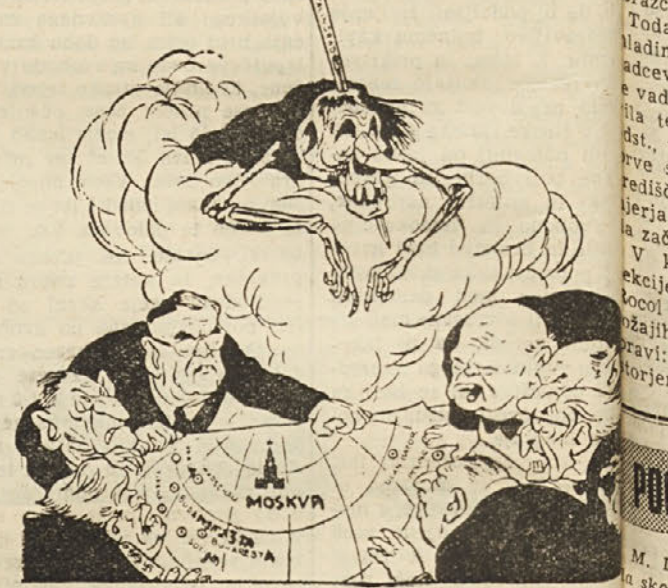
BREZUPNI NACRTI Hitlerjev duh: "Gospoda, tudi jaz sem delal nekaj in upal..."