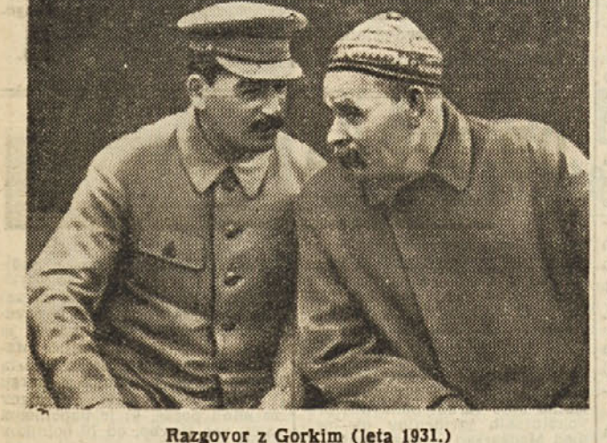
Razgovor z Gorkim (leta 1931.)

Obstoj objektivnih zakonov, ki določajo nujne odnose med pojavi, pa vendar ne predpostavljajo, da človek teh odnosov ne bi mogel spremeniti. Dogaja se prav nasprotno, to je, da, poznavajoč zakone, ki urejajo te odnose, jih mi moremo uporabiti v namenu, da dosežemo za nas koristne učinke. Na primer, obstoj zakona teže ne ovira človeka, da ne bi letel. Nasprotno, uporabljuje znanstvena dognanja o težnosti in druge naravne zakone, ki človek mogoče zgradi pripravne za letanje.