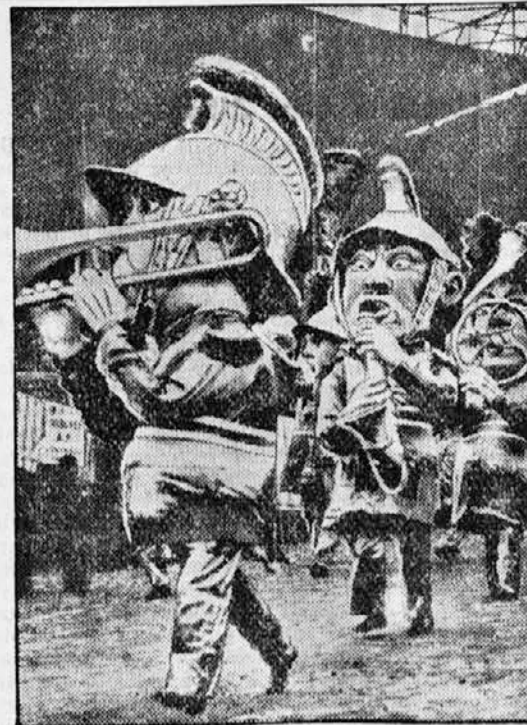
Gasilec iz Nizze na pustni torek.

Francozi so izračunali, da se bodo nove naprave sorazmerno naglo amortizirale. Saj so kaznjenci v Guayani veljali državo vsak 15 frankov dnevno, medtem ko bo v Franciji za to potreba samo 4 do 5 frankov na dan. To pa zaradi tega,