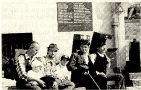
Urmoharji na letošnjem Petruvem.