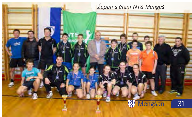
Župan s člani NTS Mengeš