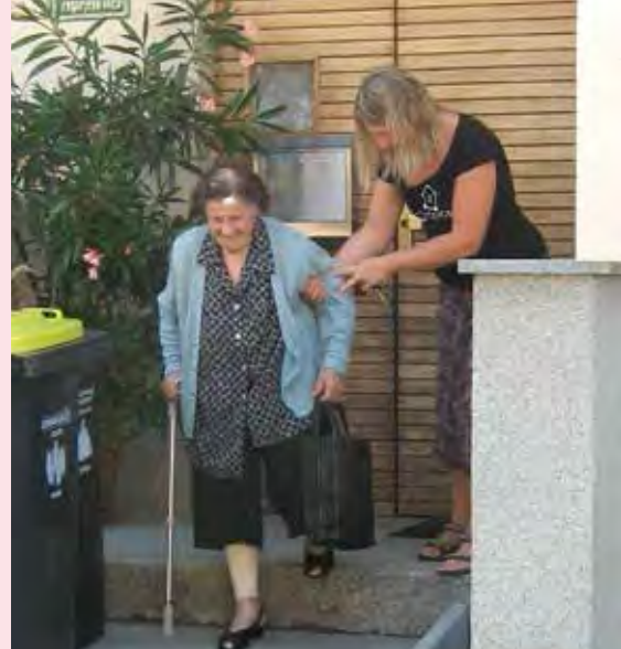
Začetki so zame pomenili dragoceno učenje, ki pa se še vedno nadaljuje

in izobraževanja kot šolska svetovalna delavka, koordinatorka za dijake s posebnimi potrebami, učiteljica praktičnega pouka, izvajalka učne pomoči. Dragocene izkušnje, tako na osebnem kot strokovnem področju, sem dobila kot dolgoletna prostovoljka na poletnih taborih in drugih programih za delo z otroki s čustvenimi, vedenjskimi in učnimi težavami.