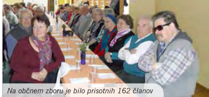
Na občnem zboru je bilo prisotnih 162 članov