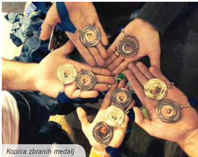
Kopica zbranih medalj