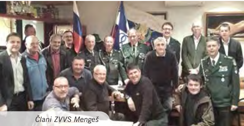
Člani ZVVS Mengeš

Zveza veteranov vojne za Slovenijo (ZVVS) je domoljubna, nepridobitna, nadstrankarska in nevladna samostojna zveza, ki deluje na območju celotne države in ima trenutno v Sloveniji preko 24.000 članic in članov. V zvezo so vključeni udeleženci vojne za Slovenijo, ki so ne glede na politična in svetovno nazorska prepričanja – kot organizatorji in pripadniki Manevrske strukture narodne zaščite, pripadniki Teritorialne obrambe, enot organov za notranje zadeve, enot Narodne in Civilne zaščite, enot za zveze, uslužbenci upravnih organov, pristojnih za obrambne in notranje zadeve, pripadniki Rdečega križa ter delavci podjetij in drugih organizacij – izvajali naloge civilne obrambe ter sodelovali v pripravah na vojno oziroma v neposrednih aktivnostih v vojni za ohranitev samostojne in neodvisne Republike Slovenije. Od leta 1998 organizacija deluje tudi v Občini Mengeš in danes šteje preko osemdeset članov.