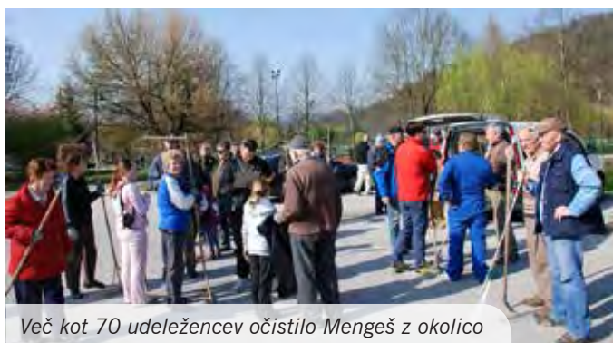
Več kot 70 udeležencev očistilo Mengeš z okolico

Tudi letošnja čistilna delovna akcija v organizaciji Turističnega društva Mengeš in Občine Mengeš je lepo uspela. K njej je pristopilo več kot sedemdeset udeležencev, ki jih je na samem začetku nagovoril župan Občine Mengeš ter se jim lepo zahvalil za udeležbo.