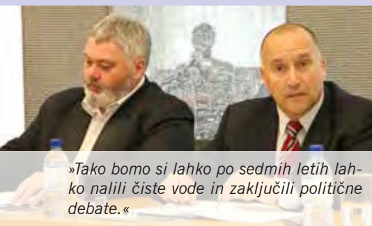
»Tako bomo si lahko po sedmih letih lahko nalili čiste vode in zaključili politične debate.«