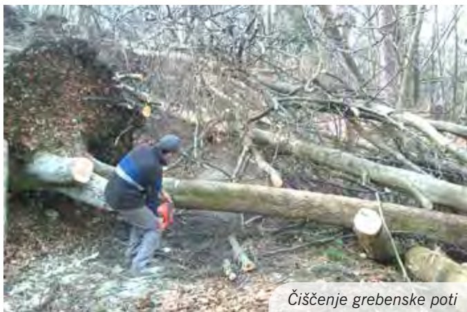
Čiščenje grebenske poti

Pomlad smo začeli s čiščenjem planinskih poti po (ž)ledeni zimi. Z motorkami in dobro voljo smo čistili Grebensko pot med Rašico in Mengeško kočo, tako da bo čim prej pripravljena na tekače, pohodnike in druge obiskovalce gozdov v naši neposredni bližini.