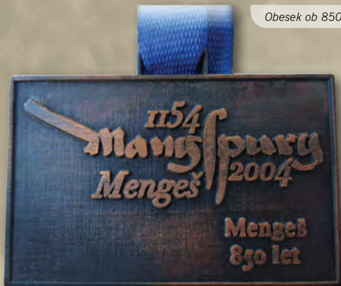
Obesek ob 850-letnici Mengša