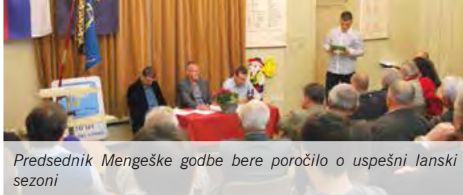
Predsednik Mengeške godbe bere poročilo o uspešni lanski sezoni