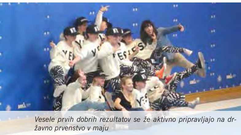
Vesele prvih dobrih rezultatov se že aktivno pripravljajo na državno prvenstvo v maju

Yes team plesalke Mladinskega centra Mengeš smo se letos prvič včlanile v plesno zvezo CZS. Tako smo se udeležile svojega prvega tekmovanja Lj open, ki je potekalo 22. marca, v dvorani Bežigrad v Ljubljani.