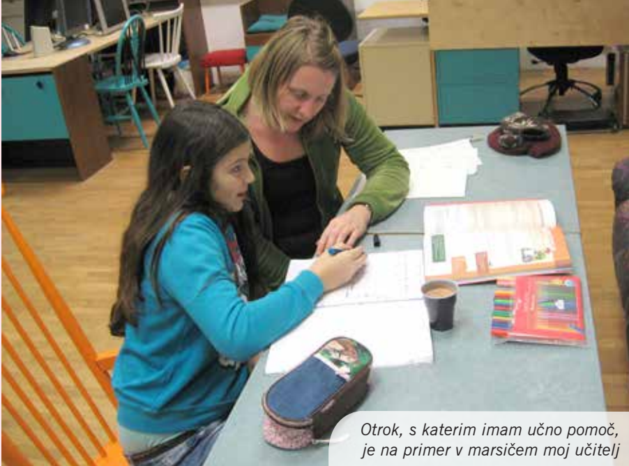
Otrok, s katerim imam učno pomoč, je na primer v marsičem moj učitelj