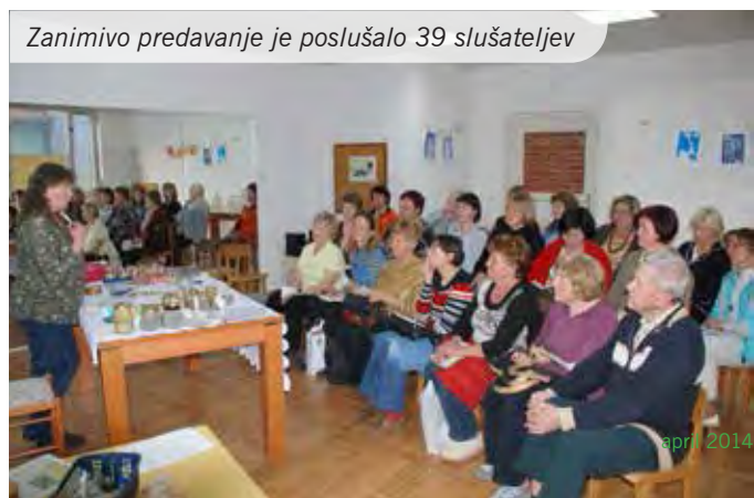
Zanimivo predavanje je poslušalo 39 slušateljev