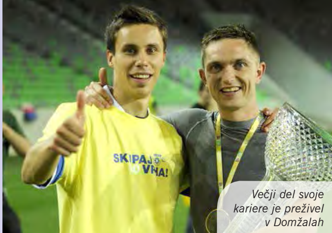
Večji del svoje kariere je preživel v Domžalah