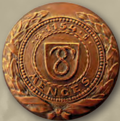
Srednjeveški grb Mengša z lovorjevim vencem