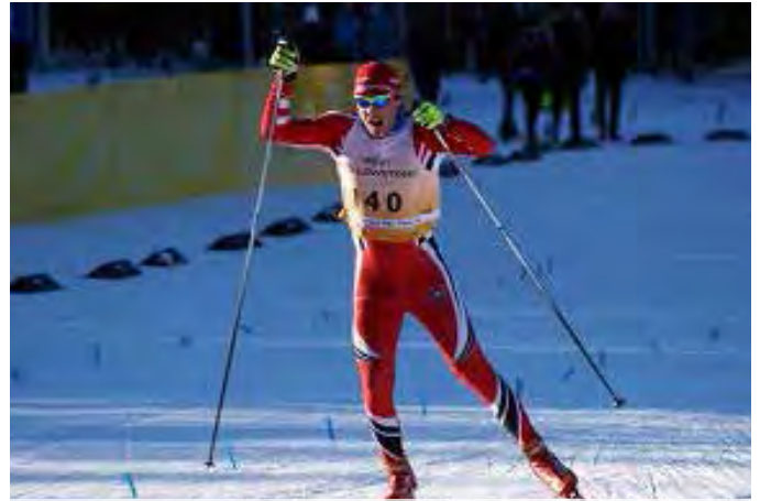
Na vseameriškem prvenstvu se je na prvi tekmi v klasični tehniki na deset kilometrov zavihtel na 12. mesto