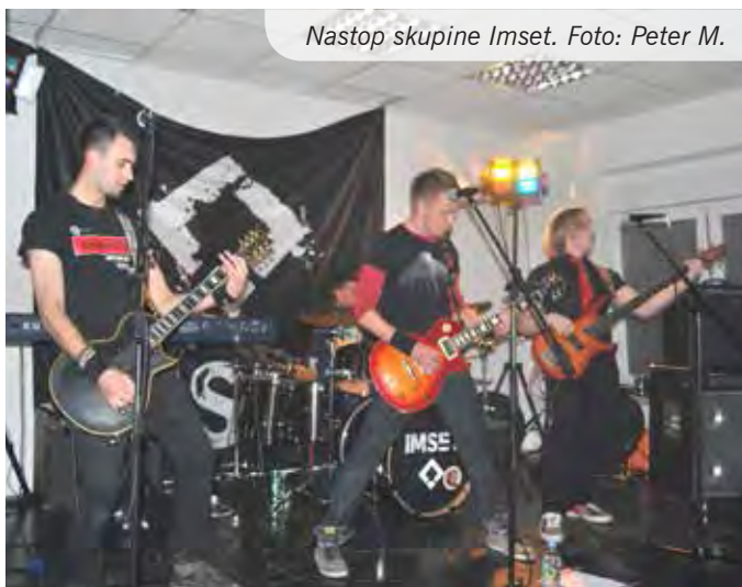
Nastop skupine Imset.

V soboto, 29. marca, se je Mladinski center tresel od dobre rock in rock'n'roll glasbe. Vzdušje se je stopnjevalo in doseglo entuziastične razsežnosti.