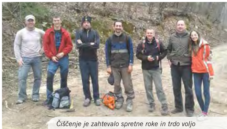
Čiščenje je zahtevalo spretno roko in trdo voljo

Prva sobota po veliki noči, 26. aprila, je rezervirana za Trimski pohod Rašica. Start bo od 7. do 9. ure, pred prostori planinskega društva (Slovenska c. 28 – na parkirišču za občino). Pohodniki hodijo v svojem tempu, na kontrolnih točkah pa zbirajo žige v kartončke, ki jih dobijo ob vpisu na startu. Pot, označena z markacijami in posebnimi oznakami, je speljana takole: prostori PD–športni park–mengeški bajer–Dobeno–vrh Rašice–grebenska pot–Mengeška koča. Zadnjega pohodnika pričakujemo do 13. ure. Na cilju bodo vsi pohodniki nagrajeni s čajem. Pot je lepa in razgledna, hoje je približno od tri do štiri ure. Upamo, da se srečamo! Mengeška koča, ki je cilj brezštevilnih izletov vsakega od