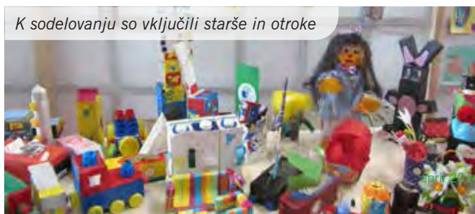
K sodelovanju so vključili starše in otroke

Besedilo in foto: Darinka Keržič, Mojca Jeraj, Mojca Slapar