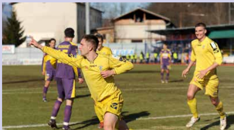
»Ko sem v lanskem letu po končanju profesionalne nogometne kariere prejel klic odgovornih iz kluba, ki so mi predstavili vizijo razvoja in delovanja, sem želel biti del te mengeške zgodbe.«