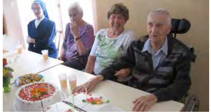
Posebno so veseli, ko stanovalci dopolnijo okrogle obletnice ali preprosto praznujejo rojstne dneve

Za tiste starejše, ki še zmorejo biti doma, pa dom ponuja dostavo hrane na dom. Hrana se pripravlja v centralni kuhinji doma in jo na vaš dom lahko dobite v času kosila. Večkrat se dogaja, ko starejši ostanejo sami v domačem okolju, da začnejo slabše skrbeti za svojo prehrano, opuščajo obroke ali jih nadomeščajo s hitro pripravljenimi stvarmi. To pa seveda ne more nadomestiti toplih obrokov. Zato je dostava toplega