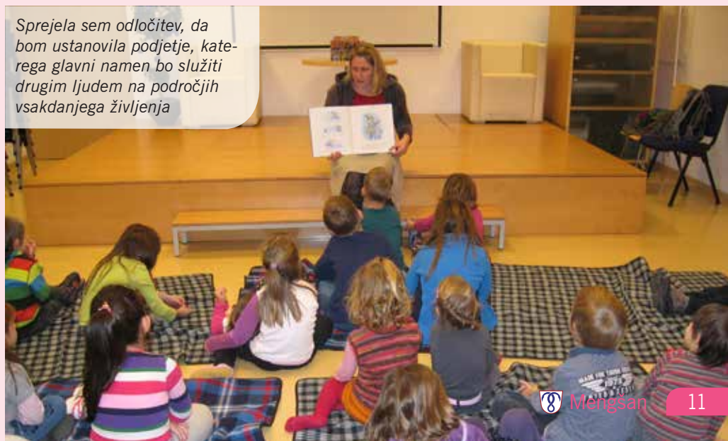
Sprejela sem odločitev, da bom ustanovila podjetje, katerega glavni namen bo služiti drugim ljudem na področjih vsakdanjega življenja

Glavno poslanstvo mojega podjetja je služiti drugim ljudem, razvila sem sto-