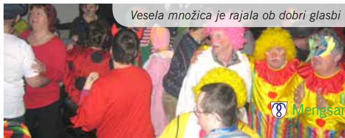
Vesela množica je rajala ob dobri glasbi

Besedilo in foto: Metka Mestek, članica društva