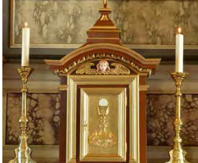
Cerkev verjame, da je posvečena hostija resnično Jezusovo telo skrito pod podobo kruha.

Prvo je malomarno prejemanje svetega obhajila, ki je v zadnjem času postala množična bolezen. O tej razvadi govorimo tedaj, ko pristopajo k obhajilu taki, ki ne verjamejo v Jezusovo resnično navzočnost pod podobo kruha ali ne živijo v skladu z Božjo voljo, ki se nočejo cerkveno poročiti kljub skupnim potomcem, ki zavestno in premišljeno ne hodijo redno ob nedeljah k sveti maši ali pa nočejo biti vsaj enkrat v letu pri spovedi. Nevredno in neverno prejemanje sv. obhajila je po krščanskem prepričanju greh. V tem duhu vas opominjamo tudi na grešna nagnjenja (napuh, pohlep, nečistost, jeza, požrešnost, zavist in lenoba), ki vodijo v smrtne grehe, s katerimi pa ni prav, da prejemo sveto obhajilo. Papež Benedikt XVI. dodaja še: uničevanje in onesnaževanje okolja, prekomerno bogatenje, ki povzroča bedo in siromaštvo, pedofilija, splav, znanstveni poskusi na ljudeh, manipuliranje z genskimi zapisi ter uporaba in preprodaja drog. Poleg tega vas opozarjamo tudi na rastočo nepoštenost in goljufije, pa