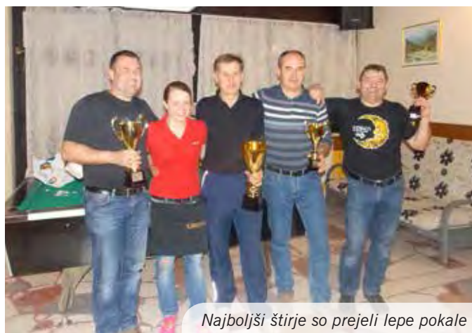
Najboljši štirje so prejeli lepe pokale