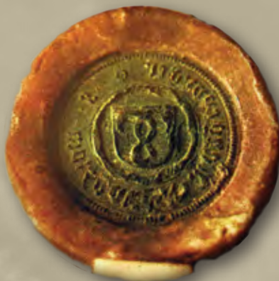
Srednjeveški pečat Mengša

Ta grb je bil kasneje osnova za celotno podobo Občine Mengeš, ki pa je tik pred realizacijo doživela spremembo.