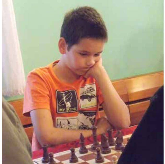
Vsi tekmovalci so prikazali svoje najboljše igre, borbenost, nepopustljivost in zbranost

Vsi tekmovalci so prikazali svoje najboljše igre, borbenost, nepopustljivost in zbranost. Še posebej izstopa rezultat v fantovski kategoriji do 12 let, kjer smo imeli kar dva tekmovalca med prvimi štirimi. Žal ti lepi tekmovalni uspehi niso najpomembnejši dogodek tega državnega prvenstva. Odhod naše-