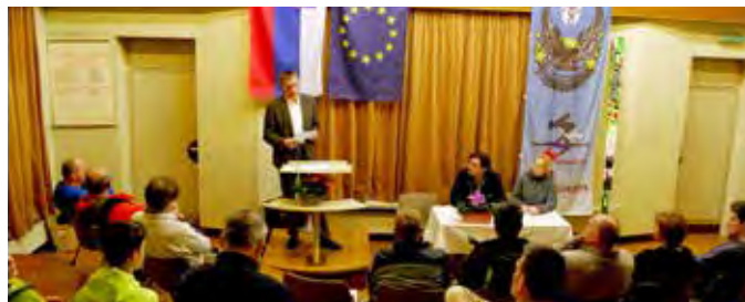
Tako kot vsako leto je vodstvo kluba sklicalo redno letno skupščino. Na njej so organi kluba podali tudi svoja poročila.