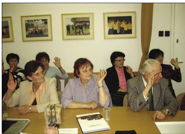
Članstvo je sprejelo poročila

drštvo z Murske Sobote, juliuša pa so šli na tradicionalno prauško na Taljansko pa na Dolenjsko. V leti 2011 je društvo organizeralo več programov v znamenji Pavlovoga leta (literarni večer, strokovne ekskurzije), cüj so pa bili na Porabskom dnevi v Andovci tö. V Sombotelu se je