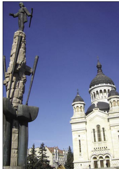
Na najveški trgaj so romanarske cerkve pa spomeniki

Človek včasik na pamet vzeme na Erdeljskom, ka so postaje za avtobuse spoj daleč od centra, pa daleč od panaufa postavili. Že tau je nej leko, ka s centra pravi