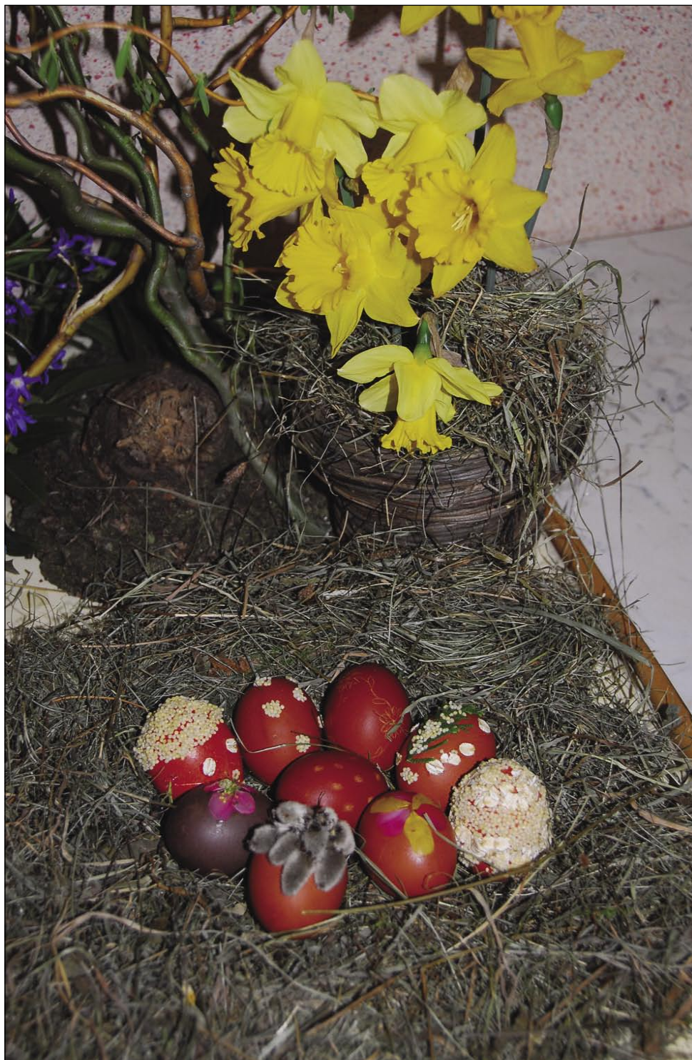
Posnetek je nastal na velikonočni razstavi v Čepincih

Naša rejč za veliko nauč je vüzem (vüzen, vuzem), stera pomeni vzeti. Se pravi, ka po 40-dnevnom posti, na vüzem