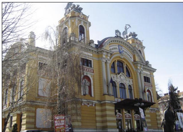
V Kolozsvári gestejo vogrska pa romanarska gledališča

Nasproti najveške ortodoksne cerkve najdemo narodno gledališče v Kolozsvári, v va-