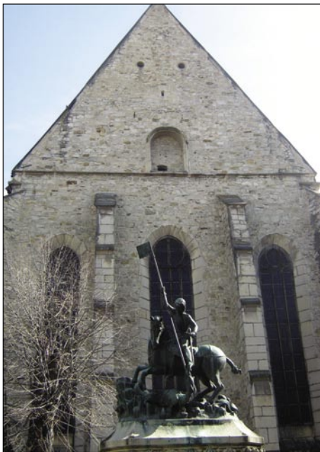
Sveti Jürrij je bujo zmaja

raši pa delüje dosta drügi vogrski pa romanarski teatrov ranč tak. Skoro na vsikšom trgi najdemo kipe romanarski junakov: fiškališ Avram Iancu se je biu prauti Mad-