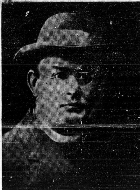
Ustanovitelj JSZ dr. Janez Evangelist Krek.

Koliko je storil dr. Krek na prosvetnem polju, ki mu je bilo zenica v očesu, ne bo nikdar odkrito. Večer na večer je imel predavanja, socialni pouk, seje, razne sprejeme sodelavcev; pisal je članke za razne liste in razprave za strokovne in leposlovne liste. Nedeljo za nedeljo in v praznikih je imel politične shode in po društvih predavanja o pomenu obstoječih organizacij in potrebi novih. Pri tem pa je bil vedno dobre volje, vedno razpoložen za šalo in koristno delo. Do revežev je bil usmiljen in radodaren. Razdal je vse kar ni imel na sebi, tako, da sam ni imel kaj