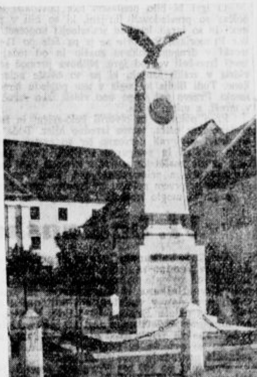
Nemški plebiscitni spomenik v Velikovu.

Tako stoji na spomeniku v Velikovu. Je bilo res tako?