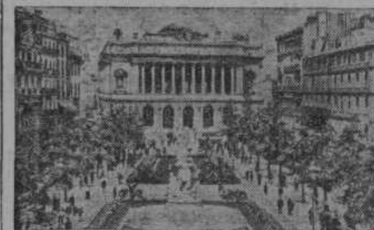
Pogled na ulico in na borzo v francoskem mestu Marseille, kjer je bil izvršen atentat na našega kralja.