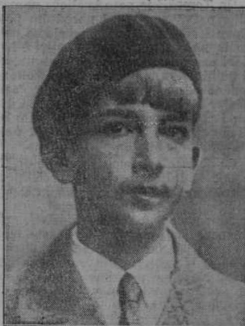
Nj. Vel. kralj Peter II.

Nekaj za oktober. Ta mesec je po naročilu slavnega papeža Leona XIII. posvečen Rožnovenski Kraljici, ki ji naj verniki spletajo duhovne vence. To delo bi nekateri radi prepuščali pobožnejše nastrojenim dušam, zlasti ženskam. Vendar pa so jagode molekove polzele tudi skozi prste mnogih znamenitih in učenih mož. Kot primer naj služi sloveči francoski zdravnik dr. Recamier, ki so ga celo svobodomisleci smatrali kot največjega medicina v Evropi. Ta mož je bil globoko-veren katoličan ter je rad molil rožnivenec. O tem je rekel nekemu duhovniku naslednje: »Moj rožnivenec mi je jako v korist ter ga zato ne morem pogrešati. Ako mi kak bolnik dela skrb, ker je njegova bolezen zelo težka, ali pa ker vsa odrejena sredstva nič ne pomagajo, ako znanost ne ve, kaj bi še porabila proti bolezni, se obrnem k Zdravniku