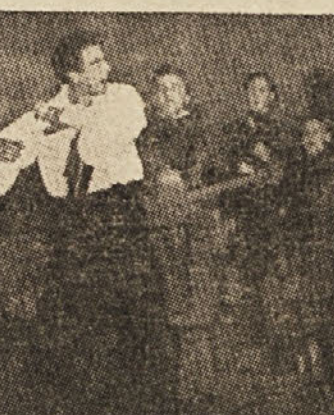
Prizor iz Mickiewiczovega dela «Pradedje», ki ga je «Teatr Polski» uprtoril ob stoletnici smrti velikega poljskega pisatelja.

Dne 13. decembra je bil otvorjen v Pragi in v največjih mestih dežele «Teden bolgarskega filma», ki je bil nekakšen pregled najbolj uspešnih del mlade bolgarske kinematografije v zadnjih petih letih. V Pragi so se na slavnosti otvoritvi v kinu Blanik srečali predstavniki kulturnega življenja z delegacijo bolgarskih igralcev, ki jo je vodil upravnik zavoda umetniških filmov v Sofiji T. Trifonov. Predvajanje bil nov bolgarski film iz življenja na bolgarski vasi in o delu zadrugarjev. Predvajani so bili v «Tejnu» dokumentarni in drugi daljši bolgarski filmi, med temi «Pesem o človeku», «Jutro nad rekjo», itd. Teden bolgarskega filma je veliko prispeval k utrditvi bratstva med nasodi Bolgarske in Češkoslovaške.