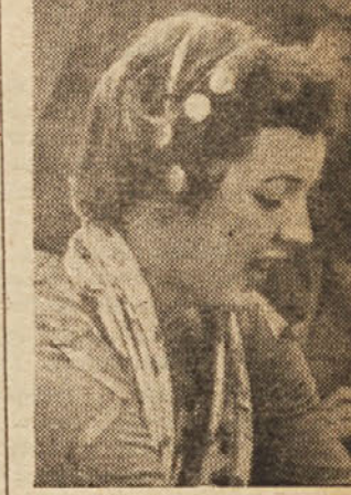
Tenley Albright (ZDA) zmagovalka v umetnem drsanju

V nedeljo popoldne so v Cortini d'Ampezo s kratko uradno in obenem sugestivno svečanostjo zaključili VII. zimske olimpijske igre, ki so trajale deset dni. Po kratkih zaključnih uradnih govorih so sneli z drogov zastave držav, ki so se udeležile VII. olimpijade ter kot zadnjo olimpijsko zastavo in ugodni olimpijski ogenj, ki je gorel skozi vseh deset dni tekem. VII. zimske olimpijske igre so bile nedvomno med najlepšimi in najbolj napetimi, kar jih je bilo do sedaj. Vzbuđile so veliko zanimanje in pričakovanje tudi zaradi prisotnosti svetovskih ekip, ki so se prvič udeležile zimskih igr. Dejansko so si Cortini tokrat delili lovorike Sovjetska zveza in Avstrija, ki sta se izkazali z največjim številom zmag. Sovjetska zveza si je priborila 16 kolajni, kar je največje število za posamezno državo. Od teh ima 7 zlatih, 3 srebrne