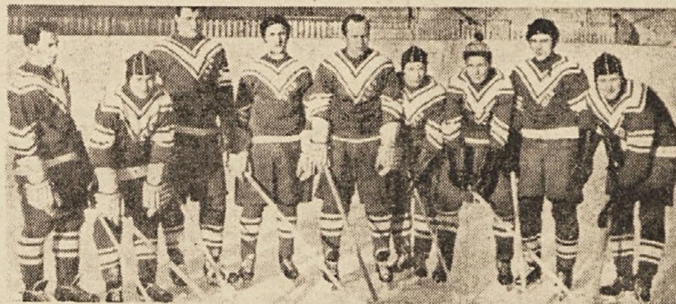
Sovjetska četa zmagovalka v hokeju