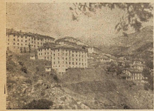
Novo rudarsko naselje v Pirinu na Bolgarskem

Veliko povečanje izdatkov za razvoj kulture je še dokaz več miroljubnega značaja sovjetskega proračuna. V to svrhu je namenjenih nad 161 milijard in sicer 14,5 milijard več kot lani. To vsoto bodo uporabili za javno vzgojo, zdravstvo, izkulturo, za državno socialno zavarovanje in socialno skrbstvo, pripravo novih kadrov, razvoj znanosti itd. Stroški za javno vzgojo, predvideni na skoro 73 milijard, so za 3,4 milijarde višji kot 1955. Stroški za obrambo so predvideni na 102,5 milijard, do čim so znašali lansko leto 112,1 milijard rubljev. Omejena postavka predstavlja letos 18% vseh izdatkov, dočim je bila leta 1955 19,9 odstotkov.