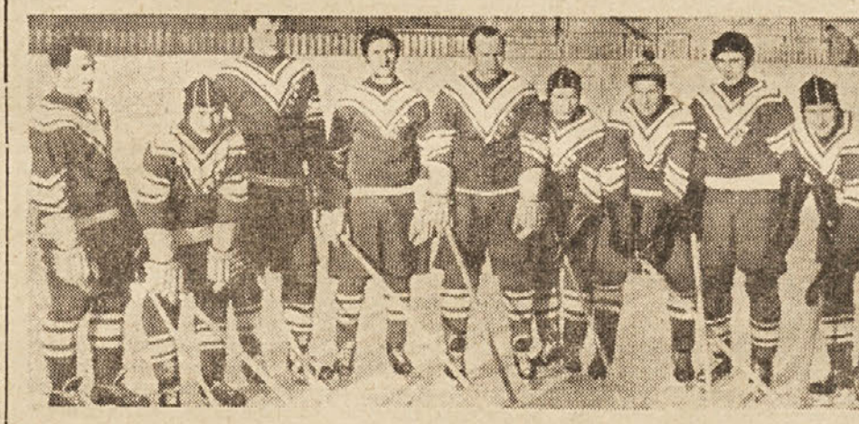
Sovjetska četa zmagovalka v hokeju