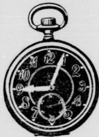
Lasna znamka „1 K 0“ najbolj zanesljiva ura.

tako se stiši mnogokrat popraševati ljudi, kateri pač imajo uro v žepu ali na steni, ampak svoji lastni uri ne verjamejo, ker je le slaba, netočna, vedno stoječa bazar ura. Kdor nasprotno ima Suttnerjevo uro, ve vedno natanko, kako pozno je.