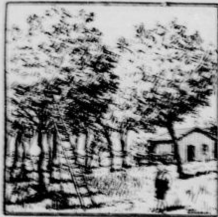
Kje je oča, ki se sel čreshnje nabirati?

Kaj bo v nedeljo novega? Tako vprašuje vsak, kdor vé, kako zanimivo predstavo v nedeljo preskrbi občinstvu v Ljubljani »Kino Central« v deželnem gledališču. V nedeljo predstavlja krasno igro v treh dejanjih »Vojna sprava«, velekomično »Kuharične sanje«, veseligr »Vutke v nabuhlosti« ter najnovejša kinematografska vojna poročila. Tudi za mladino primerno! Predstave se vrše tako, da se jih pred ali po nedeljskih službah božjih lahko vsak udeleži: ob 1 h 11, dopoldne, ob 3., 1 h 5, popoldne, ob 6., 1 h 8, in 9, uri zvečer. — Prihodnji torek se vrsti globoko presunljiva drama »Očetovska ljubezen«, sijajna veseligr »Hrabri krojaček« in slika iz življenja »Pasja zvestoba«. Obisk pri predstavah je vedno večji, ker podjetje nudi res vedno zanimive in nove stvari.