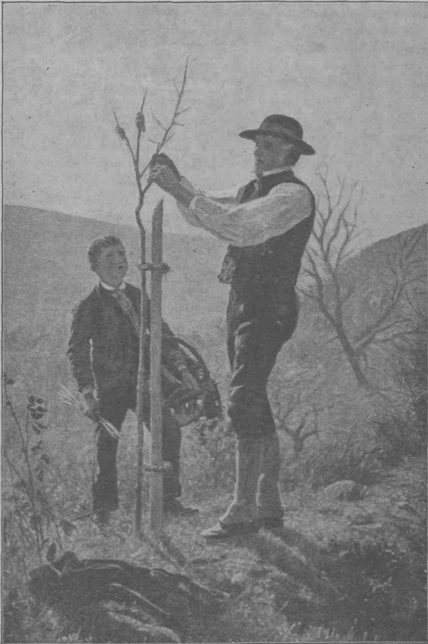
Kakó oče cepí sadno drevje.