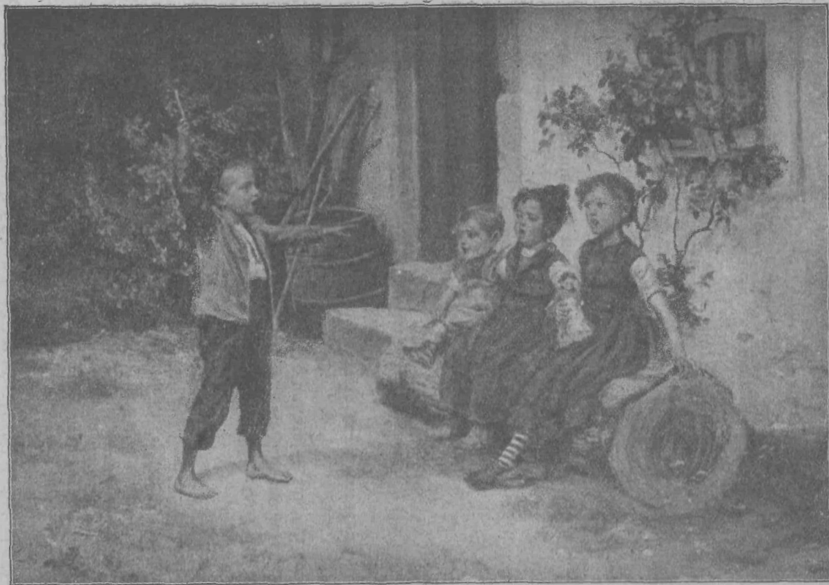
To pa, to!