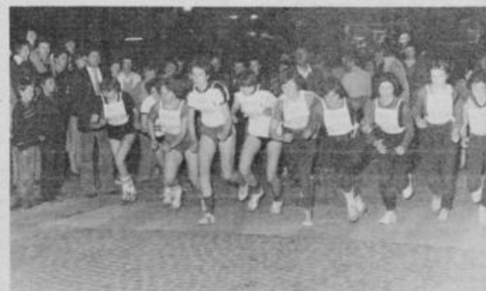
Start mladink in članic