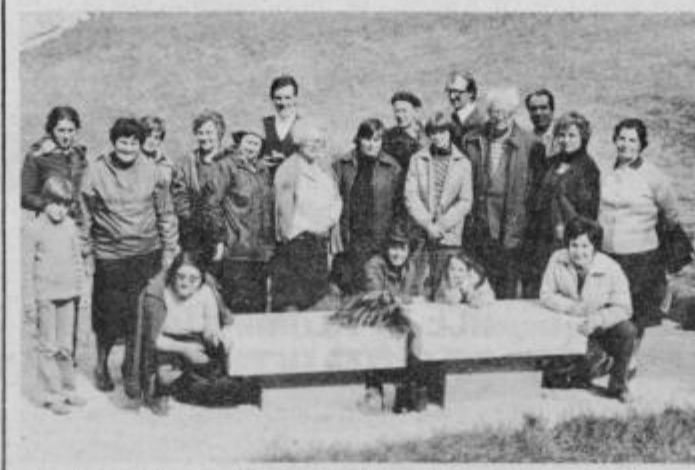
Spominsko obeležje padlim na Javorskem pilu