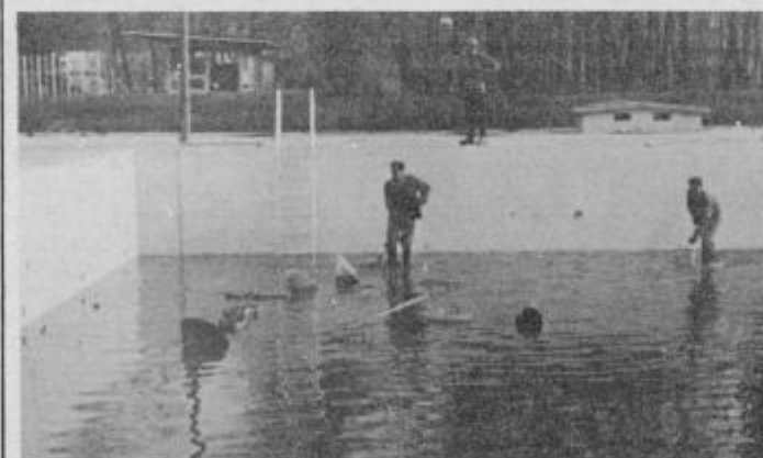
Na dnu olimpijskega bazena leži vrsta odvrženih predmetov

pravi. Že lani smo opozarjali na to, kakšno škodo lahko napravimo s tem, če v bazenu ni vode in težki, oster predmet, ki je vržen v bazen lahko predre aluminijasto dno bazena. Zaradi tega je še toliko večja dolžnost, da v okviru družbene samozasčite ostrimo nadzor nad takim poče-