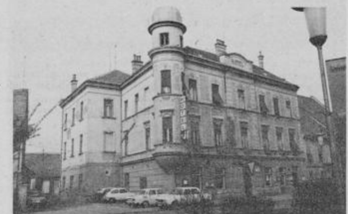
Hotel Planina v pričakovanju svetlejših turističnih ber.

K temu pa ni prispeval samo odpadajoči omet, ampak nemalokrat tudi počasna postrežba. Lahko bi rekli, da je ta pomankljivost zadnje