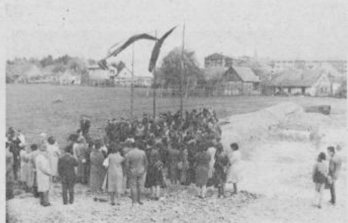
Dom učencev bo prva zgradba v novem zazidalnem okolišju; Rabelčjeva vas — zahod.