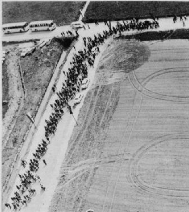
Na kolone pohodnikov je bil veličasten pogled od zgoraj

Iz slovesnosti so poslali pozdravno pismo tov. Titu in mu