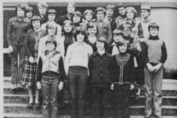
Učenci so se s svojim izbranim programom pred odhodom na gostovanje v Švico v četrtek zvečer predstavili tudi svojim staršem.