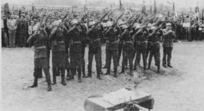
Častna salva v počastitev spomina na padle borce

sem bila presenečena, ko so se ljudje umaknili s prostora, kjer je bila svečanost. Za seboj so pustili vse odpadke; od papirja, do steklenic in ostankov sadja. Prijetna okolica, lep pogled k spo-