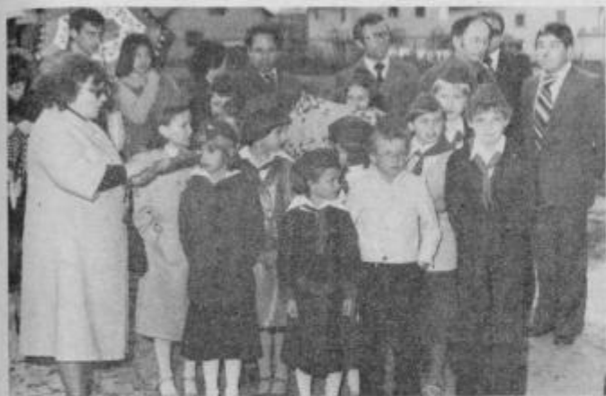
Pionirji iz KS Boris Zihel pred svojim nastopom.