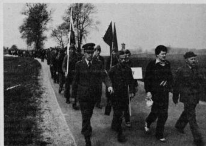
Kvedrov odred na poti proti Dornavi