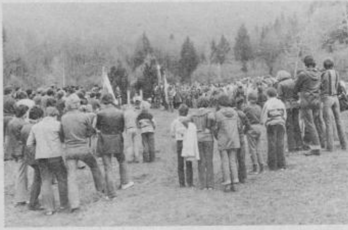
27. aprila pred spomenikom NOB na Boču