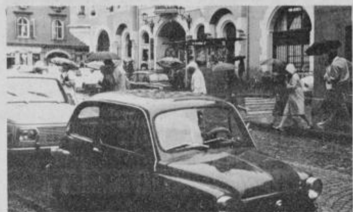
Trg MDB pred magistratom v Ptuj je bil v soboto zatrpan z avtomobili.