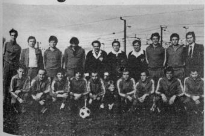
Moštvo Aluminija z osvojenim pokalom