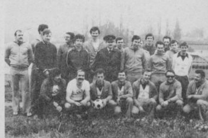
Člani ekipe PM PTUJ pred začetkom tekmovanja.

Končni vrstni red je bil sledeč: prvo mesto in s tem prehodno zastavico »REZERVNI MILIČNIK« je dosegla ekipa prometne milice iz Maribora. Drugo mesto