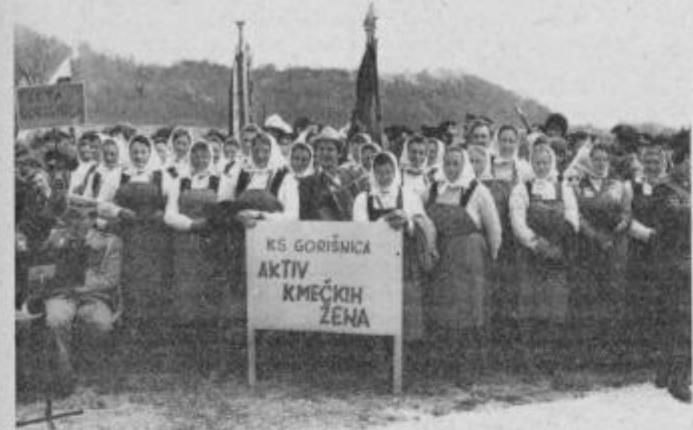
Pohoda v Mostje bi se udeležilo še več žena iz goriškiškega aktiva, pa je doma toliko dela, ki ga je treba opraviti.

V jeseni bi rade pripravile kmečki večer. Na prireditvi bi predstavili delo na kmetiji oziroma — kako se je nekoč na kmetiji čufalo perje. To bi bila prireditev