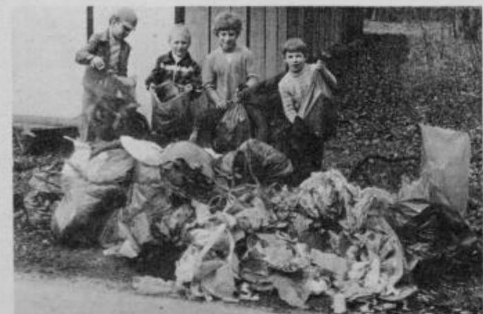
Takšen kup odpadkov in smeti so zbrali pridni mladi zbiralci samo okrog garaž.