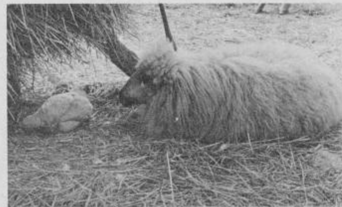
Ali ovca čaka na jajček, ali samo dela družbo putki?