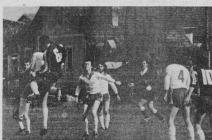
S srečanja Drava — Kladivar

(66) Tement, 2:1 (75) Hvalec; Drava: Štebih, Malek, Tement, Šmigoc, Trlep, Matič, Emeršič.