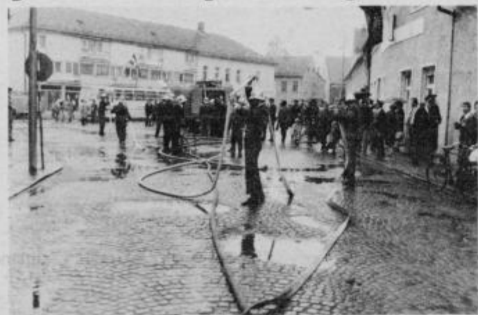
Da je bila mokra vaja zares mokra je potrdil tudi dež. Kljub temu so ptujski in krapinski gasilci svojo nalogo dobro opravili.

Za tem je pred hotelom Poetovio v Ptuj bil koncert gasilske godbe iz Krapine, kljub razmeroma slabemu vremenu pa so se pobrateni gasilci obeh društev nekaj trenutkov pozneje dobro izkazali v mokri vaji, ki so jo izvedli na zgradbah v Trstenjakovi ulici. Ptujski gasilci so tokrat prvič praktično uporabili novo mobilno gasilsko leste in tudi dokazali kako praktična je.