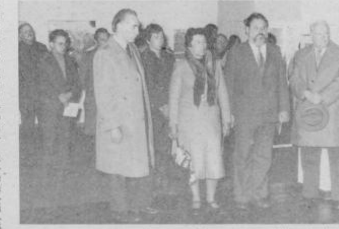
Z otvoritvene slovesnosti retrospektivne razstave slikarske kolonije Poetovio — Ptuj v paviljonu Dušana Kvedra.