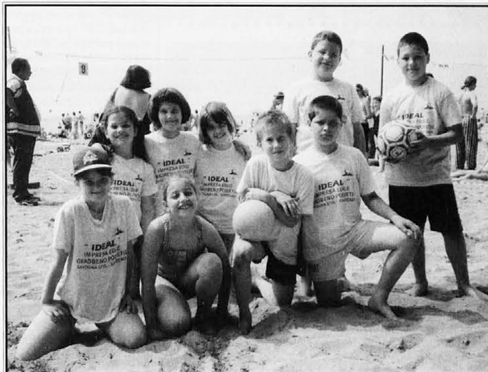
Mladi odbojkarji Soče Ideal na plaži v Gradežu

Ob robu igrišč se je zbralo veliko število staršev, prijateljev in mimoidočih kopalcev, ki so z zanimanjem sledili prvim športnim podvi-