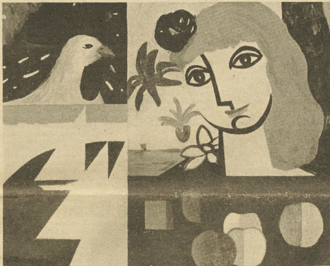
Polde Oblak: Pomladne sanje, tempera na platnu. Avtor slike je ta mesec prejel v Neaplju veliko zlato medaljo za avantgardno slikarstvo na razstavi ob 6. evropskem razpisu za razna področja umetnosti. Podelila mu jo je Evropska akademija za književnost, znanost in umetnost pod pokroviteljstvom predsednika evropskega parlamenta Pieta Dankerta. Razstava bo obiskala še pet italijanskih mest. Objavljena podoba predstavlja dekle in njen svet, ki ga ponazarjajo petelin — simbol budnosti, razpeta jadra v zalivu kot prisodoba teženj po daljavi in sadeži — simbol rodovitnosti. Spodbudni temi so ustrezne optimistične pester barve, živahni tonski kontrasti, jasne oblike in mehak krožni ritem celote, kjer ob moderno zasnovani fragmentarici gradnji slike in stilizaciji detajlov začitimo tudi tradicijo slovenskega slikarstva, predvsem vitrojev in podob na steklo.