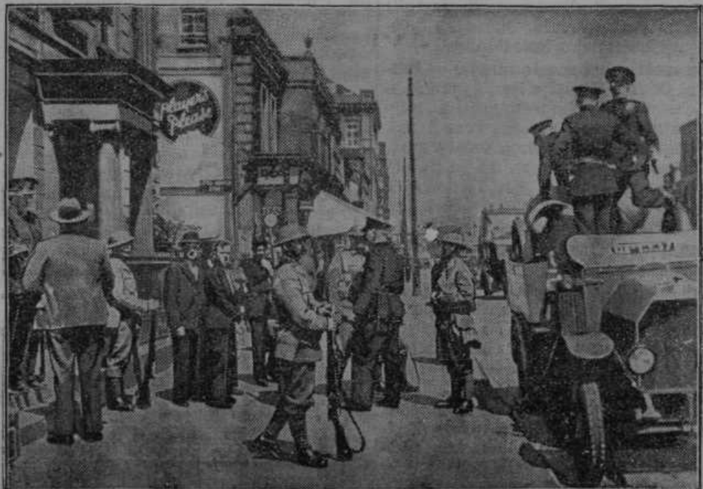
Nemiri na Irskem. V mestu Belfast je došlo do spopadov med katoličani in anglikanskimi protestanti. Slika nam predstavlja nastop policije proti izgrednikom.