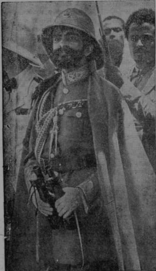
Abesinski cesar v maršalski uniformi.