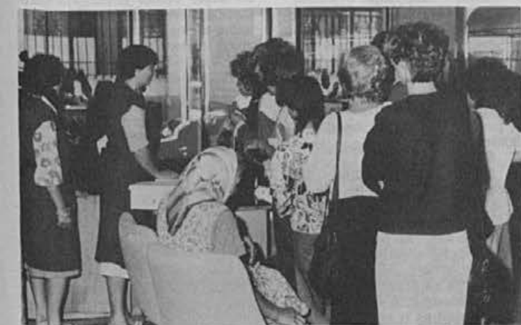
Posel v prodajalni na Ptujju že kar lepo cvete. K temu ne pripomorejo samo lepo urejena prodajalna in ustrezna obutev, temveč tudi prijazne prodajalke