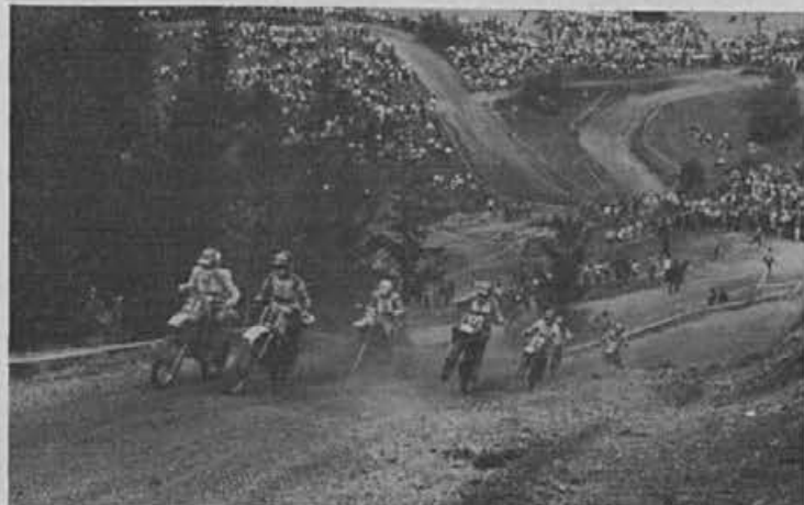
Atraktivna vožnja motokrosistov vedno pritegne množico gledalcev

Takih prireditev, kot je bil motokros na Breznici zadnjega avgusta, si še želimo. Taka je le-