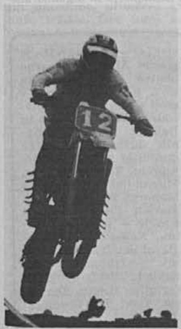
Albin Jesenko med vožnjo