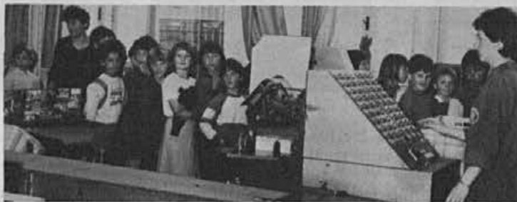
So morda med njimi naši bodoči delavci?