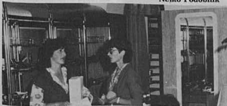
Kako pomembno je, da znamo prav svetovati našim kupcem