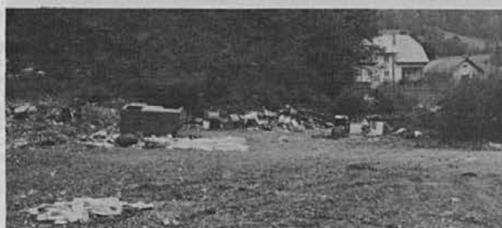
Morda sitnarimo, bi rekli, ko kar po večkrat objavljamo neprijetne fotografije. Toda že po tem, ko so z odlagališča sekundarnih surovin v nekdanjem kamnolomu v Osojnici odstranili smeti in odpadke, ki so skorajda že silili na cesto, so nekateri čez noč navozili novo navlako. Kljub kontejnerju in organiziranemu odvozu smeti v kraju