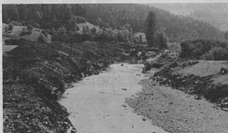
Regulacija Sore se je ta mesec premaknila že nad žirovski most