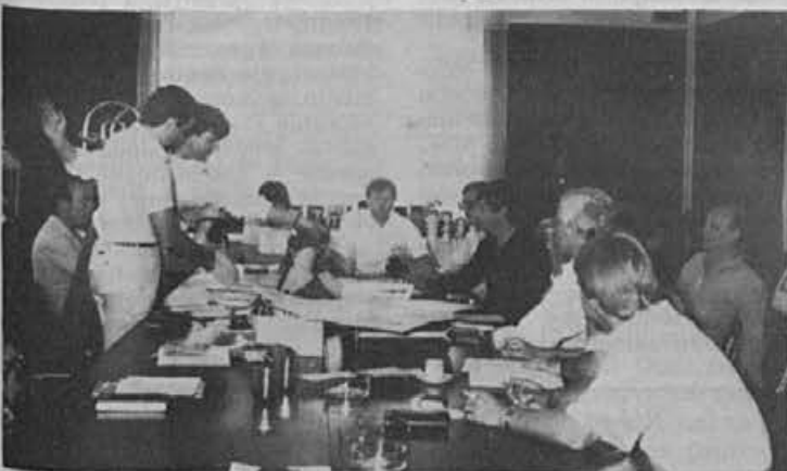
Z enega izmed srečanj z našimi kupci

Namen obiska pri naši firmi v ZDA je bil, da kupce-potnike, ki prodajajo naše čevlje v ZDA prepričamo, da je kakovost obutve za sezono 1986/87 boljša od lanske in da so napake, ki smo jih drago plačali, odpravljene.