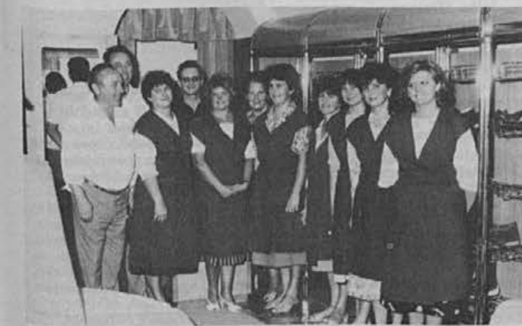
«Gasilski posnetek» kolektiva prodajalne v Ptujju ob našem obisku

Začeli smo sicer kar na Mestnem trgu v Škofji Loki. Nova ekipa v razmeroma lepo urejeni prodajalni dosegala lepe uspehe. Morda za ilustracijo le tale droben podatek; lani je ta škofjeloška prodajalna dosegala bruto promet, ki jo je uvrščal na 61. mesto v naši maloprodajni mreži, letos pa je po rezultatih prodaje sedmih mesecev na 50. mestu. Rekli bi, ni kaj; kar tako naprej! Kljub skladišču izven stavbe in skromnim prostorskim možnostim.