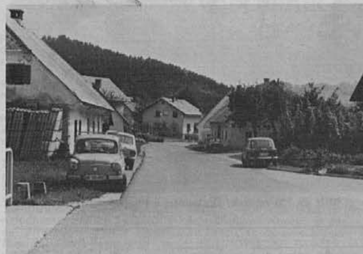
Tu bomo začeli z gradnjo pločnikov in obnovo ceste, pa vse tja do žirovskega mostu. Vmes je še veliko nerešenih vprašanj