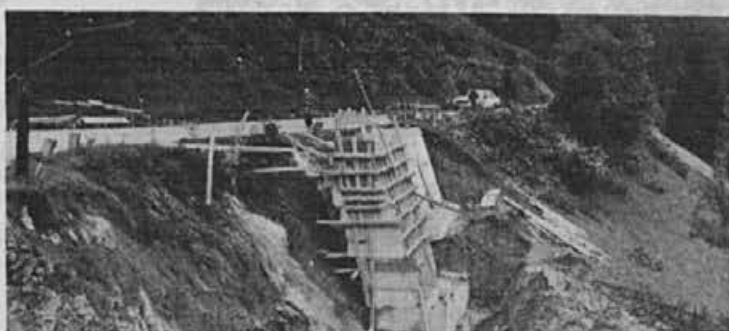
Kot kaže, bo z gradnjo ceste Žiri—Trebija veliko dela, neprijetnosti in stroškov