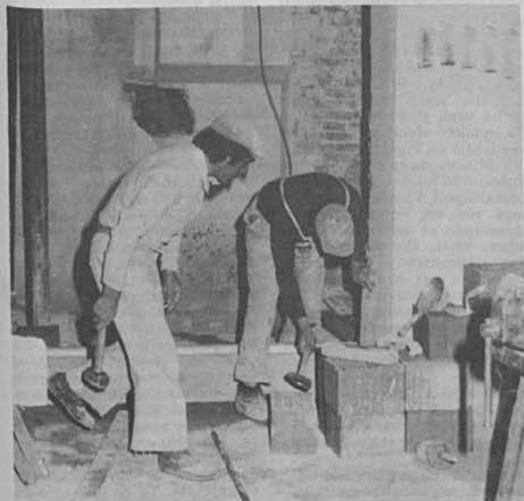
Obnova prodajalne v Celju je v polnem teku. Dela izvajajo delavci Ingrada, opremo pa bodo pripravili v naših vzdrževalnih obratih. Tako bo ta uspešna prodajalna v kratkem spet odprta