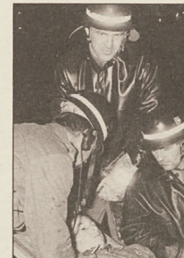
Eden od „namišljenih“ ranjenih „pasažirjev vogrške katastrofe.“