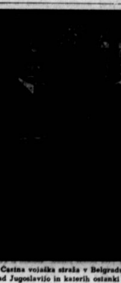
Časna vojaška straža v Beogradu ob simbolični takvi ameriških letalcev, ki so v zadnji vojni padli nad Jugoslavijo in katerih ostanki so bili 21. jan. prepežani v Ameriko.