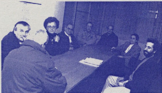
Je bila razprava ZLSD o krajevnih skupnostih uspešna?

Kako bodo zaživele nove krajevne skupnosti bo treba seveda še videti, res pa je, da takšnih kot smo jih poznali, ne bo nikoli več. Odločanje se se bolj centralizira in manevrskega prostora za takoimenovano soodločanje "običajnih" ljudi je vse manj. Odlok o krajevnih skupnostih, ki ga objavljamo tudi v tokratnih Uradnih objavah, je po mnenju predlagateljev naravnano tako, da krajanom še naprej omogoča uresničevanje njihovih lokalnih interesov. Kdo ima prav pa bo pokazal čas.