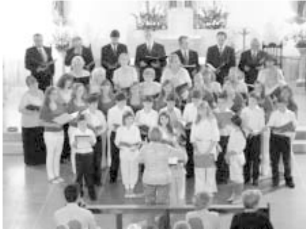
Nastopajo združeni zbori

Morda nam, starejšim še kdaj uhaja spomin na mrzle in zasnežene božiče iz našega otroštva. Vendar so sedaj naši božični prazniki drugačni. So topli, svetli in polni sonca. In taki so prazniki naših otrok in vnukov.