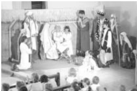
Prizor živih jaslic