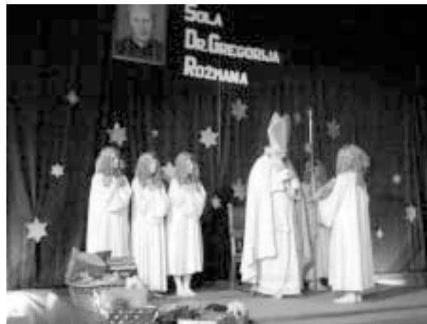
Sv. Miklavž prihaja

Prve naloge so se lotili učenci in učenke 5. in 6. razreda. Uprizorili so Slomškovo pesem Potepena šolarja in sklenili so, da bodo upoštevali škofov nauk. Drugi nalogi so bili kos otroci 7. in 8. razreda. V Župančičevi pesmi Naše luči so odkrili, katera je naša zadnja luč. Ta je duh, ki nam k Bogu pota razodeva! Iz knjige so naposled priskakljali palčki skakalčki (3. in 4. razred), prikupno zaplesali in razložili tretjo nalogo. Vsi otroci so veselo in