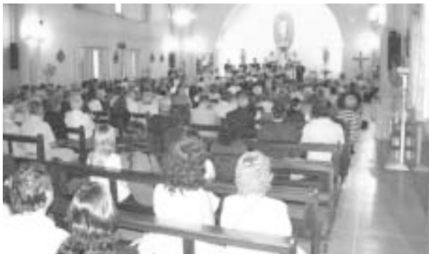
Občinstvo je zbrano sledilo koncertu

Ko so otroci odšli je iz zbora izstopila