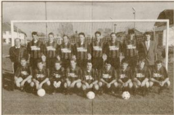
Ekipa Mladina iz Lovrenca.