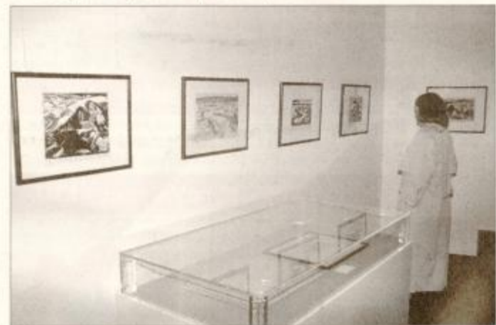
Z razstave v Mestnem muzeju v Oldenburgu 1997

ORMOŽ / LJUDSKO UNIVERZO OBISKALA DELEGACIJA OECD