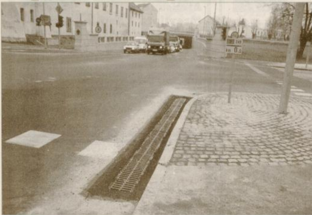
Odtoke za meteorne vode v podvozu so zgradili na več mestih.