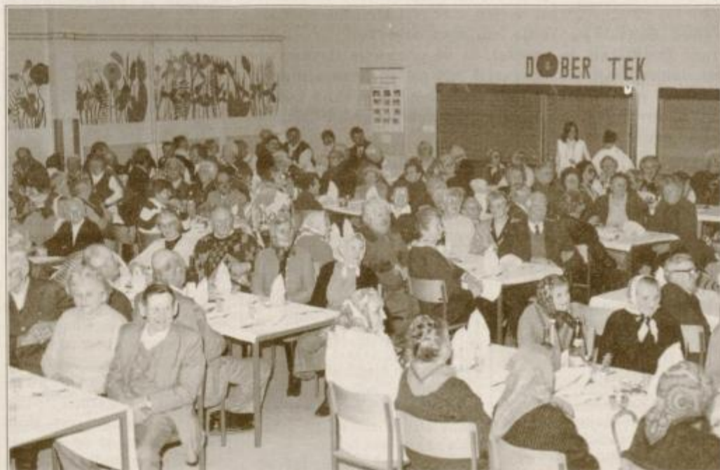
Udeležba je bila precejšnja, vzdušje pa prijetno.

Reklama za znani Puhov motor (ilustrirani Slovenec, l. 1913, str. 139, last Žuraj, Ptuj).