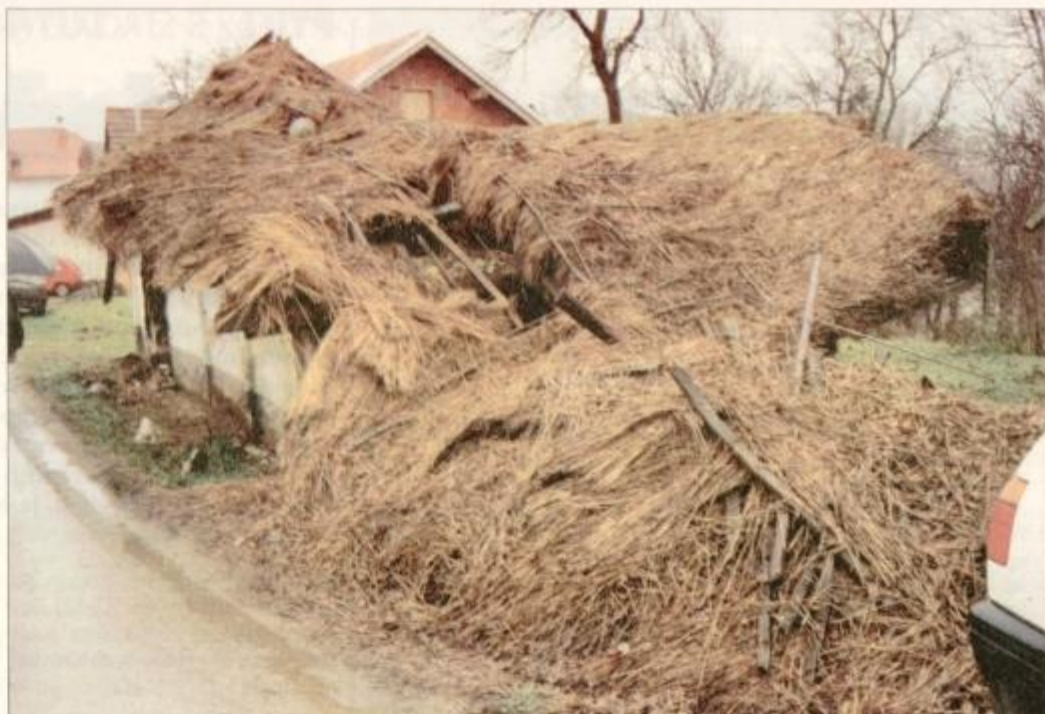
Od nekoč prelepega etnološkega spomenika v Vitomarcih 58 je ostalo malo sledi.