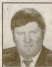
VSI NJEGOVI ☐

Hvala vsem, ki se ga spomnite z lepo mislijo.