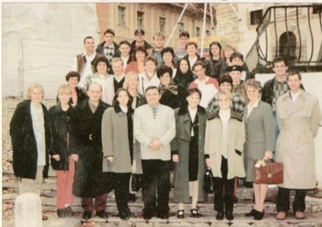
Prvi udeleženci programa prekvalifikacije za poklic kuharja in natakara.