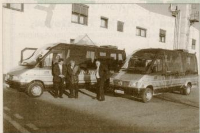
Mercedesova minubusa na dvorišču ptujskega Certusa kmalu potem, ko so ju pripeljali iz Nemčije.