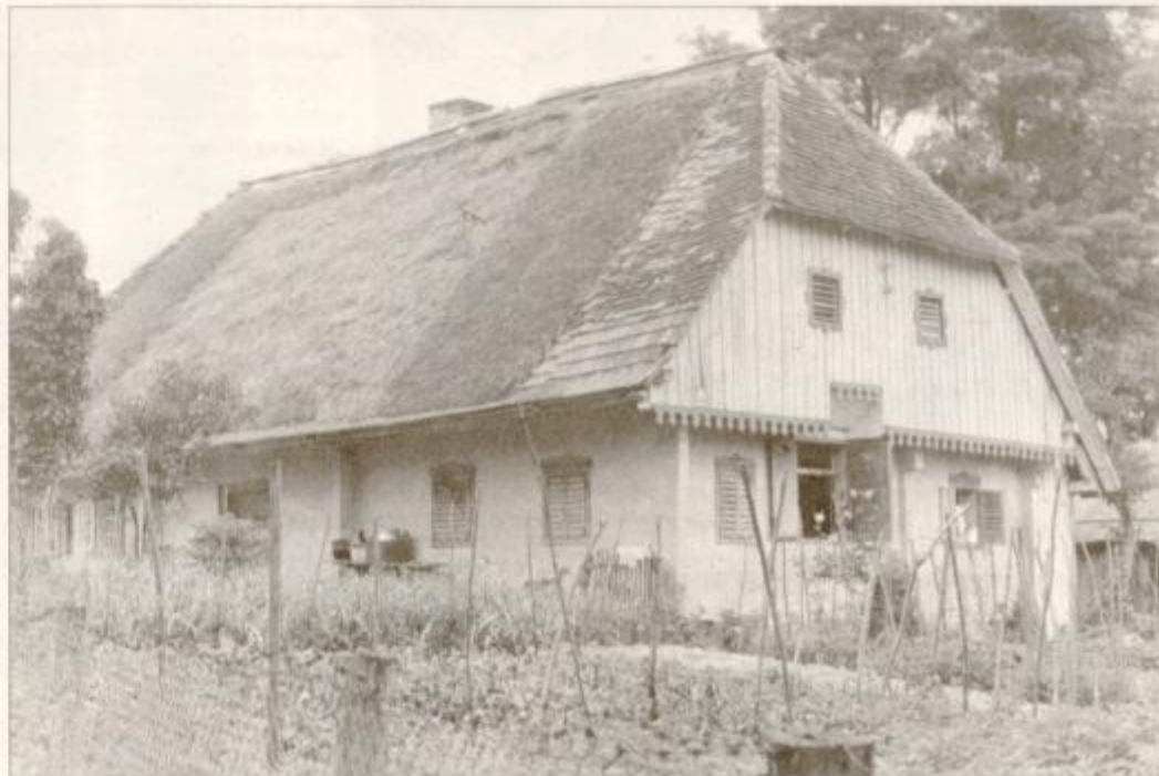
Oeltjenova hiša za Grajeno pred prezidavami leta 1984