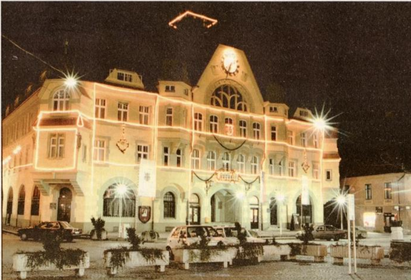
Mestna hiša je odeta v praznične lučke ...

TENZOR 062 779-788 PTUJ hišni alarmi avtoalarmi domofoni video . nadzorni sistemi