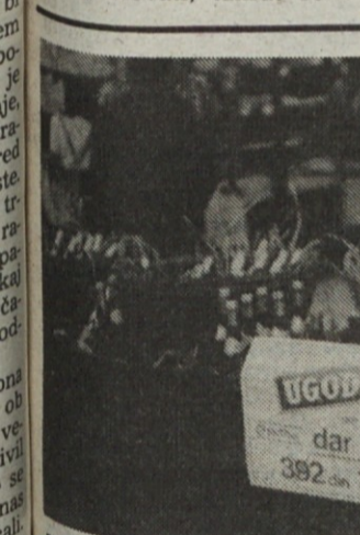
Čprav je še poletje, je dar jeseni – ptujsko vino – v blagovnici Centromerkurja v Ljubljani že na voljo kupcem.