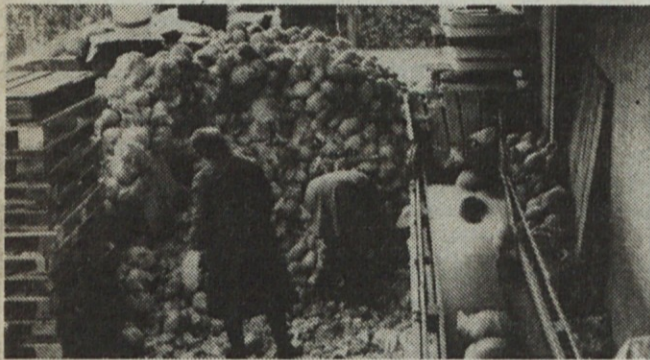
Zelnate glave, ki bodo v dnevih, ki so že pred vrati kmalu na naših mizah spremenjene v priljubljeni segedinski golaž in primorsko joto.

Istočasno se zahvaljujem vsem, ki ste kakorkoli pripomogli k razvoju našega Kmetijskega kombinata. Hvala vam!