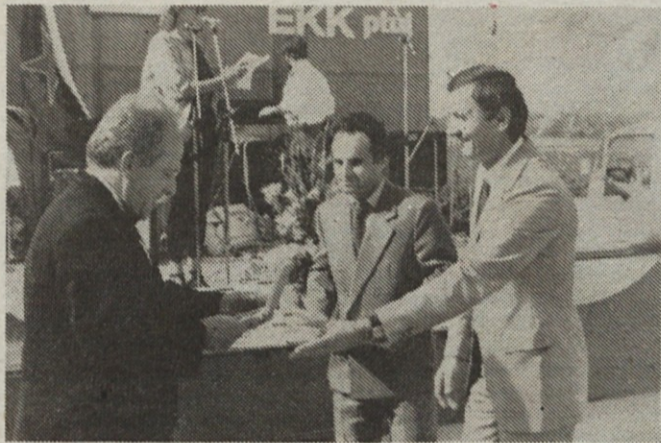
Čestitke ob podelitvi državnih oblikovanj.