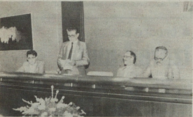
S slovesne otvoritve ekonomske fakultete v Emoni.

Škoda po požaru, ki znaša po grobih ocenah približno