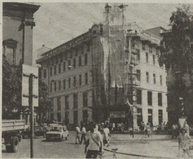
Kar na strehi blagovnice Centromerkur v Ljubljani so trije umetniki oblikovali nov kip boga Merkurja, fotografirano dan pred odstranitvijo zaščitne zavese, ko je blagovnica zablestela v novi »obleki« in novim Merkurjem na vrhu pročelja.