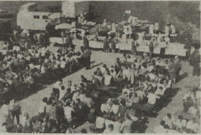
Proslava na Ptujju iz ptičje perspektive.