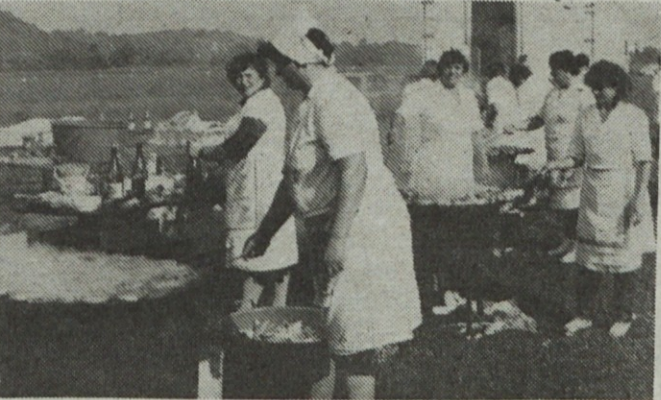
Cigansko pečenko, piščančje perutničke znajo ptujske kuharice pripraviti res odlično.