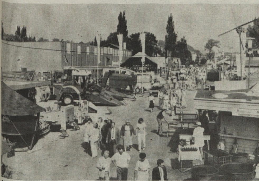
Na mednarodnem živilsko-kmetijskem sejmu v Gornji Radgoni