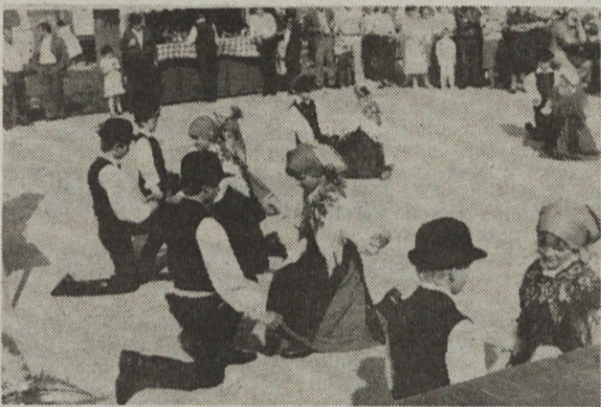
Vleče suštar dreto ... nastop mladih iz Markovcev.