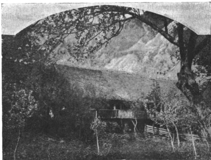
Kmetiški dom na Gorenjskem