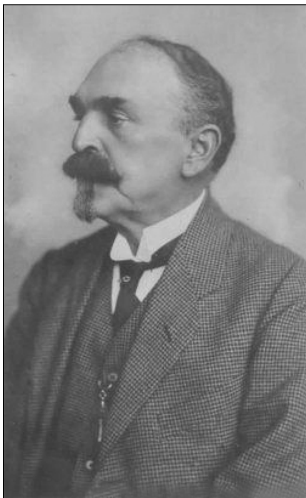
Sl. 3: Portret Albina Belarja

Dr. Albin Belar (1864–1939), vsestranski naravoslovec, predvsem pa znan po svojem delu na področju seizmologije, se je zanimal tudi za naravne znamenitosti (Sl. 3). V uvodu feljtona je navedel navodila za inven-