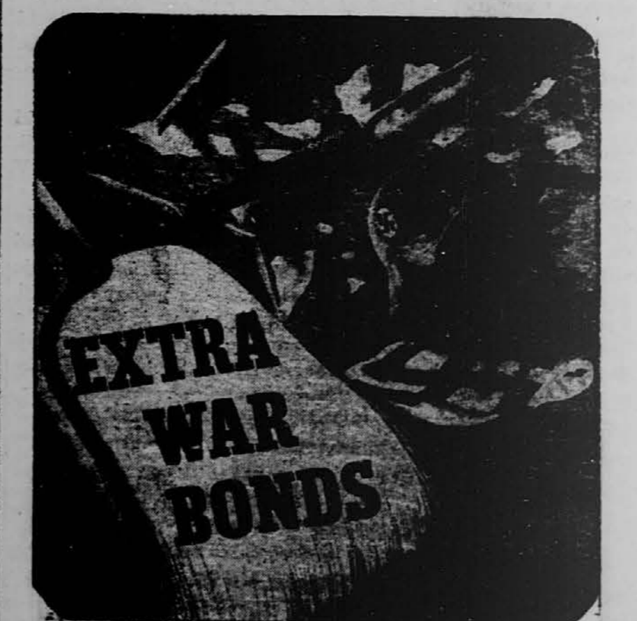
KUPITE EN "EXTRA" BOND DANES!

Ti begunci niso iz taborišča El Shatt v Egiptu, kakor smo pred dnevi poročali, temveč iz raznih taborišč v Italiji, iz katerih jih je rešila zavezniška armada.