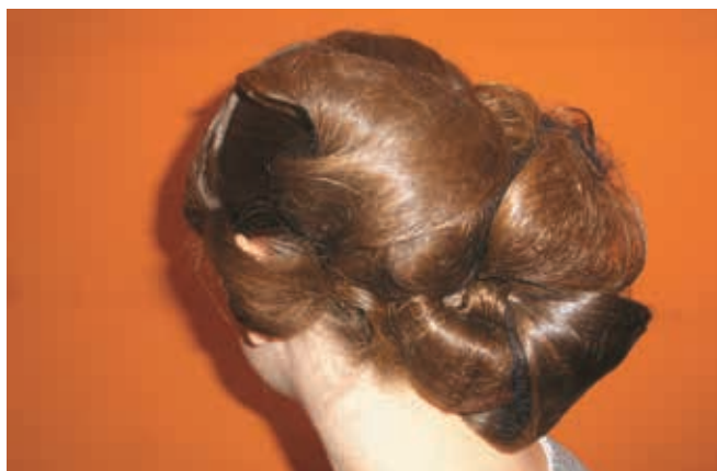
Navdušujoče speti lasje