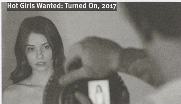
Hot Girls Wanted: Turned On, 2017

Kako razumeti to nelagodno zmes treh pornografskih in treh ne-ravno-pornografskih epizod? V seriji Turned On trda erotika očitno zlahka sobiva z ljubeznijo, porno industrija pa z intimnimi, osebnimi, zasebnimi razmerji. Proizvodnja pornografskih vsebin postane primerljiva in zamenljiva z navezovanjem medosebnih stikov in afektivnih razmerij, pa naj gre tu za razmerja seksa in ljubezni (Tinder) ali pa posilstva (Periscope). S tovrstno potezo, ki porno posel postavlja ob bok zgodbam o ljubezni, spolnemu delu ponovno ni priznan status, ki mu ga dokumentarni film zavrača že desetletja: Hot Girls Wanted , tako celovečerec kot šesturna serija, nam vsak na svoj način sporočata, da produkcija pornografije še vedno ni in ne more biti delo . Če pa že je delo, in tu je poanta serije, pa je pornografija obenem tudi nekaj več (je ljubezen, je navezanost, je čustveno razmerje). Turned On ne dovoljuje, da bi seks pred kamero postal zgolj služba – v njem mora biti nekaj posebnega, nekaj presežnega. A morda bi dokumentarni filmi spolno industrijo pravzaprav še najbolj natančno prikazali, če bi ji ta posebni status za začetek odvzeli , in za razliko od neštetihih dosedanjih poskusov do nje pristopili skrajno materialistično. »To je samo moja služba,« pravi ena izmed porno igralk v Netflixovi seriji – in ali ne bi bilo čudovito, če bi na pornografijo enkrat za spremembo tako pogledal tudi film? E