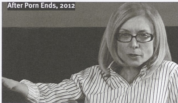
After Porn Ends, 2012

že izpostavljenih trdi erotiki – hote ali nehote. To sta le dve izmed neštetihih veličastnih statistik, s katerimi nam v svojih štiriinosemdesetih minutah postreže Hot Girls Wanted (2015), odmevni Netflixov dokumentarec režiserk Jill Bauer in Ronne Gradus ter producentke Rashide Jones (sicer slavnejše po igralskih nastopih v serijah Parks and Recreation in ameriški različici The Office ). Avtorice za svoje izhodišče uporabijo, po besedah uradnega sinopsisa, »'amatersko' porno industrijo ter ženske, ki jih le-ta izkorišča«. Sprva se zdi tovrsten zastrašujoč opis popolnoma iskren in natančen: Hot Girls Wanted se v veliki večini res osredotoča na izkoriščevalske, ponekod fizično nasilne pripetljaje skupinice nadobudnih osemnajst-do-dvajsetletnic na začetku pornografskih karier. Res se ob gledanju sprva zdi, da je pet osrednjih mladostnic brez vednosti vpleteno v brezizhodno verigo izkoriščanja in zlorabe ter da si je skorajda nemogoče predstavljati grozovitejšo ali mračnejšo karierno pot, kot je seks v navzočnosti kamere – tak je vsaj vtis, ki nam ga na vsak način želi posredovati Hot Girls Wanted .