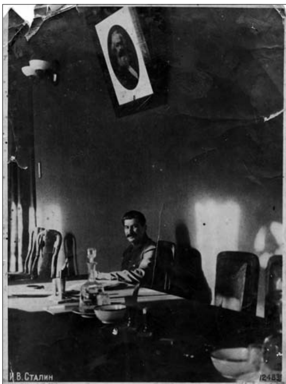
Stalin za delovno mizo pod fotografijo Marxa, Berlin 1935.

strahu in hkrati težnja po monolitizmu. Kdor ni bil popolnoma za oblast, kdor je imel kakršne koli zadržke, je bil proti. In kdor je bil proti, je bil »zelo nevaren«... Pa čeprav niti ni bil član KPJ ali je bil celo antikomunist.