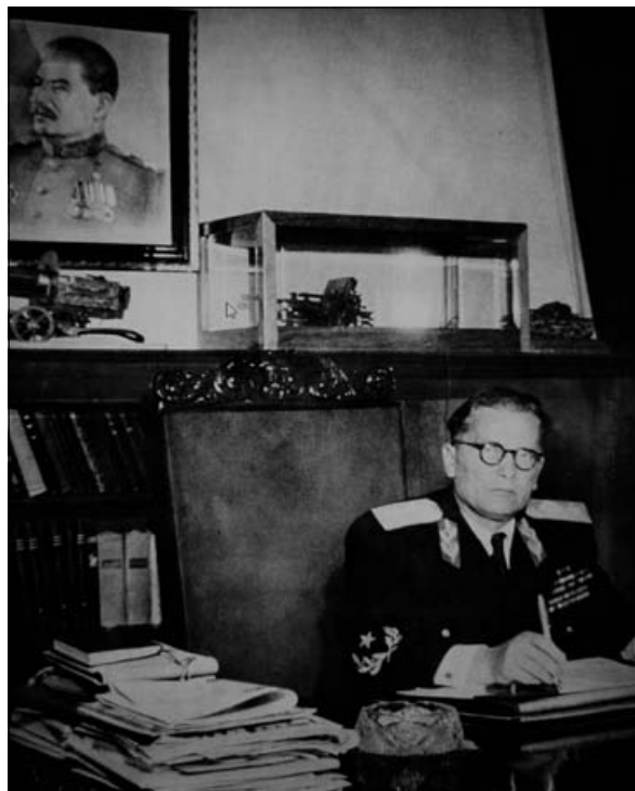
Tito je spočetka gradil svojjo legitimnost kot nadaljevalec Stalinovega dela.

Rankovićevemu obisku so poleg uprave taborišč velik pomen pripisovali tudi interniranci sami, saj