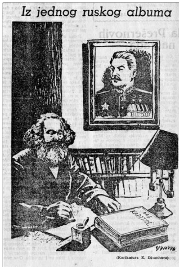
Zuko Džumhur, Iz jednog ruskog albuma (Književne novine, 14. 2. 1950, str. 2)

ustvarjati v revoluciji in kot je ustrezal njegovim težnjam in pogledom ...« 98