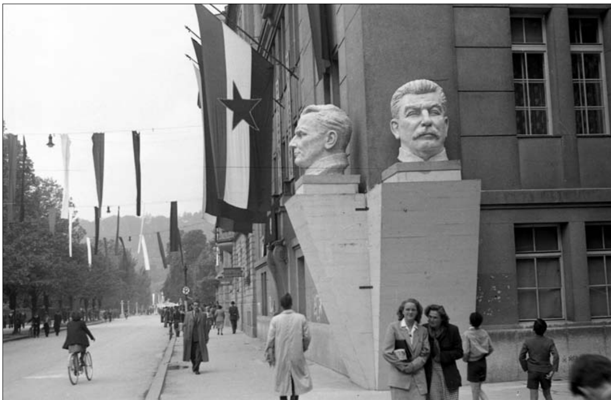
Spomenik Stalinu in Titu, Ljubljana 1947

čun z njim in katoliško cerkvijo kot sodni proces. 32 Po vseh teh procesih je bilo vsakomur jasno, da pod režimom » diktature proletariata « kritika ni dobrodošla in da ima lahko že najmanjša kritična pripomba za posledico hudo kazen. 33