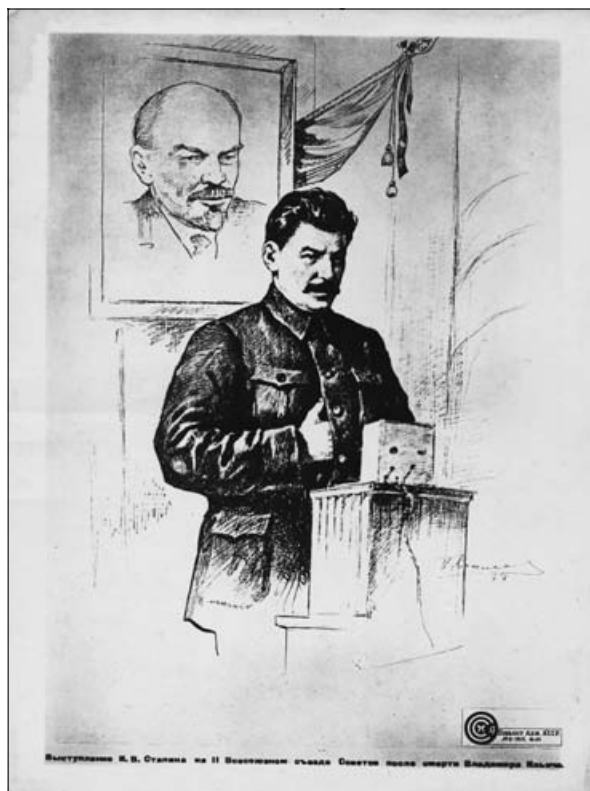
Stalin je svojo legitimnost gradil na dediščini Marxa in Lenina. Na risbi Stalin med govorom na II. Vsesojuznem kongresu sovjetov po smrti Lenina.

konec meseca septembra 1948. Resolucijo Informbiroja so z aklamacijo sprejeli na skupni seji vlade in Narodne skupščine. Na skupni seji je predlagatelj resolucije Petar Stambolić, med drugim, dejal, da ta organ ne more ostati ravnodušen do neresničnih in klevetaških napadov »na našo deželo, našo državo in njeno zakonito vlado« . Čeprav ta gonja poteka pod krinko kritike manjše skupine ljudi, je to »objektivno napad na vso našo deželo in njen razvoj in da je dejansko nemogoče ločiti naše politično in državno vodstvo od ljudstva, ker ono oziroma Vlada FLRJ, ki jo je ta Dom izbral in postavil, vodi takšno zunanjo in notranjo politiko, kot ustreza interesom naših delovnih množic in naše dežele, kakor tudi interesom svetovnega demokratskega reda« . 40