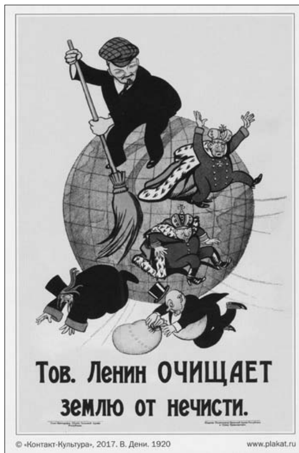
Tovariš Lenin čisti Zemljo od smeti, karikatura iz leta 1920.

katerim je hotela okrepiti svojo kontrolo nad državo in odstraniti svoje aktivne nasprotnike iz vrst prejšnje oblasti. 7