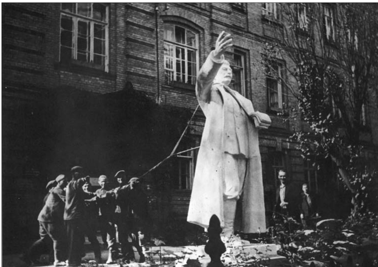
Podiranje Stalinovega kipa po diktatorjevi smrti, Grodno (Poljska).

zadeve in poveljnik Udbe je takšno mnenje označil kot »veliko napako« in javno pojasnil, da bodo sodišča še naprej »najstrožji in najneizprosnejši sovražnik vseh pojavov, ki škodujejo socialistični skupnosti ali ogrožajo njen obstoj«. 102