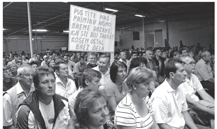
Zborovanje delavcev migrantov

Ivec meni, da se Ustavno sodišče v odločbi, s katero je pritrdilo Brglezu, sklicuje na svoje prejšnje odločbe. Takrat je sodišče zaradi zlorabe človekovih pravic kaznovalo Ludvika Poljanca, ki pa mu je potem pritrdilo Evropsko sodišče v Strasbourgu. Poleg tega so ustavni sodniki zavrnili pobude delavcev migrantov za začetek postopka za oceno ustavnosti sedmih zakonov.