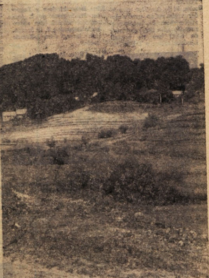
DEL NOVEGA SADOVNJAKA — slikan s ceste Mlinšah—Trata

Iz dosedanjih razgovorov in načrtov zagorske Kmetijske zadruge izhaja, da se bodo življenjske razmere tamkajšnjih prebi-