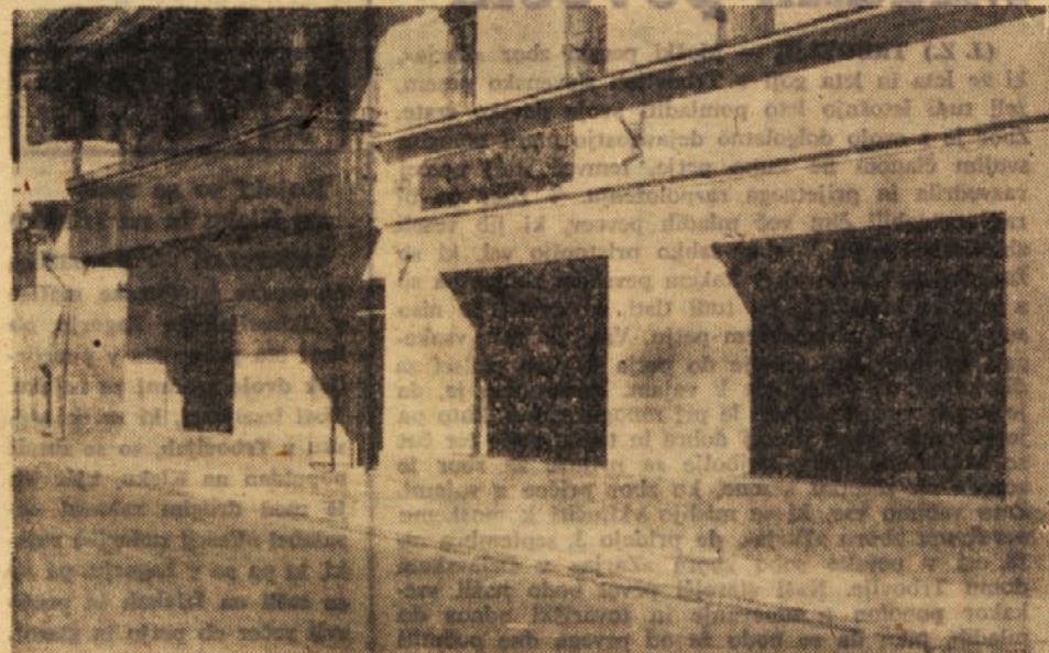
KMALU BODO IZROČILI NAMENU SE ENO FREUREJENO SPECIALIZIRANO TRGOVINO — poslovalnico veletrgovine »Mercator« iz Ljubljane na Valvazorjevem trgu. Zdaj je treba opraviti še notranja ureditvena dela in trgovino opremiti