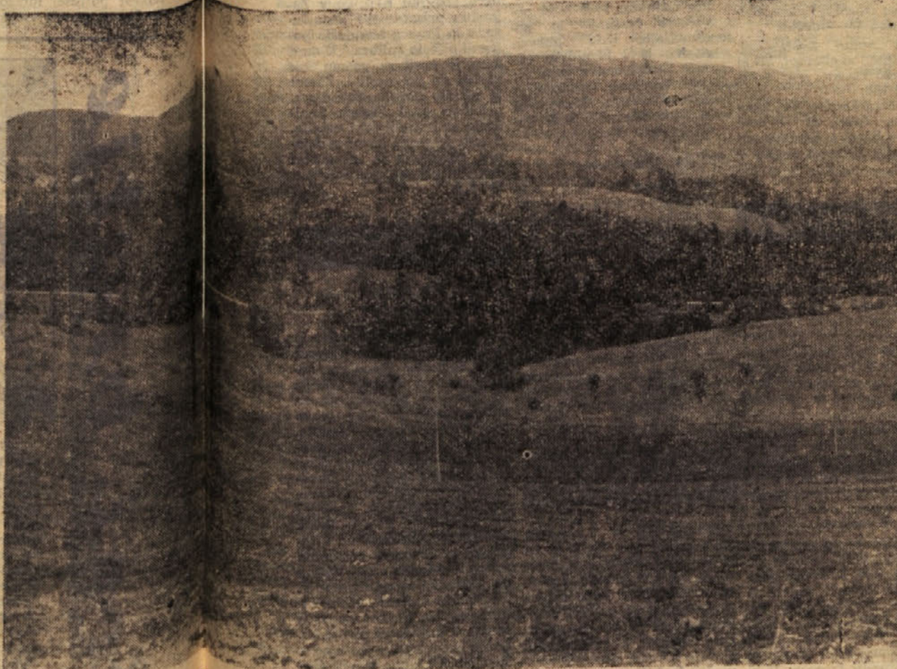
KANDRSKI SADOVNJAK — raztezal s področja zagorske občine tudi v domžalsko občino, in sicer vse do Vojnega dola

● Lahko bi še pisali o teh novih poteh socialističnega sektorja zagorskega kmetijstva. Razumljivo je, da v kratkem obdobju ni mogoče oceniti, če so vse oblike, za katere so se odločili zdaj, najbolj primerne. To bo mogoče z večjo gotovostjo ugotavljati čez leto dni. Ze sedaj pa se je pokazala ena od pozitivnih posledic odcepitve gozdarskega odseka zagorske Kmetijske zadruge je zdaj le začela iskati svoje mesto v kmetijstvu zagorske občine in proučevati možnosti za nadaljnji razvoj in napredek socialističnega sektorja kmetijstva; vzporedno s tem pa tudi za večanje in utrjevanje pogodbenega sodelovanja z individualnimi kmetijskimi proizvajalci. Tekst in foto: (ma)