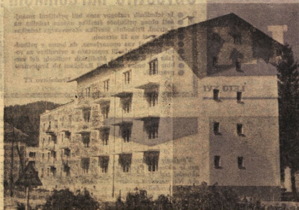
V PREDILNICI LITIJA posvečajo vso pozornost tudi reševanju stanovanjskih vprašanj. Letos bo vseljivih 26 novih stanovanj, prihodnje leto pa nadaljnjih 20 novih stanovanj. Na sliki: stanovanjski blok na Stavbah, v katerega se bodo že v kratkem vselili člani kolektiva litijske Predilnice