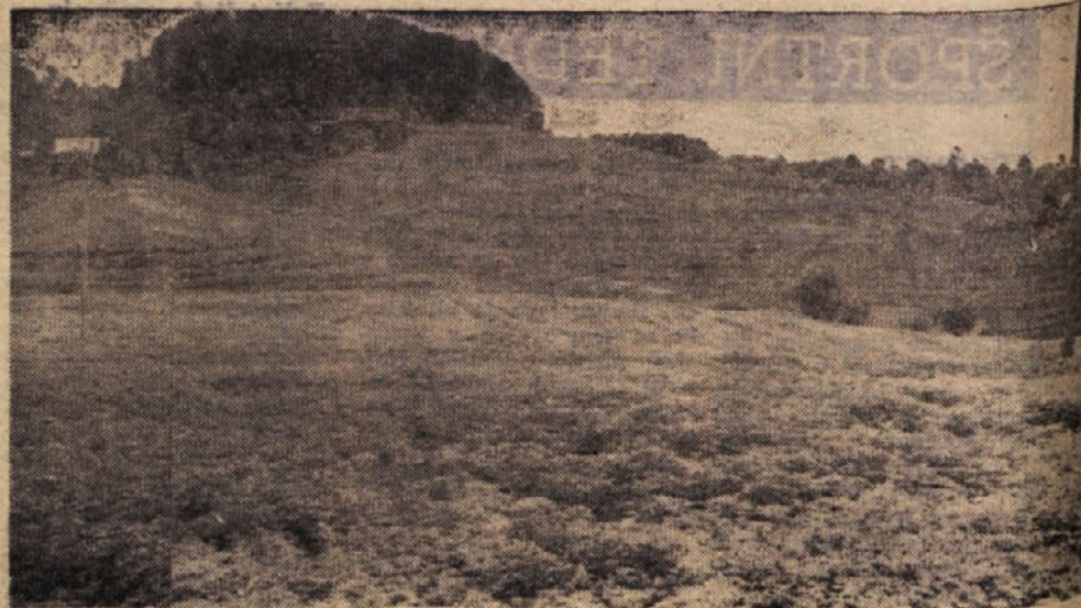
KMETIJSKA ZADRUGA ZAGORJE OB SAVI UREJUJE V KANDRSKAH NOV SADNI NASAD

iskala svoje vloge in nalóg v zagorskih pogojih kmetijstva. Malo razprav pa je bilo doslej tudi o ožji specializaciji udejstvovanja v kmetijstvu.