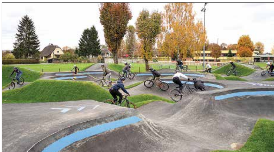
Kolopark bo omogočal rekreacijo na prostem, izboljšanje spretnosti vožnje s kolesi in medgeneracijsko druženje.