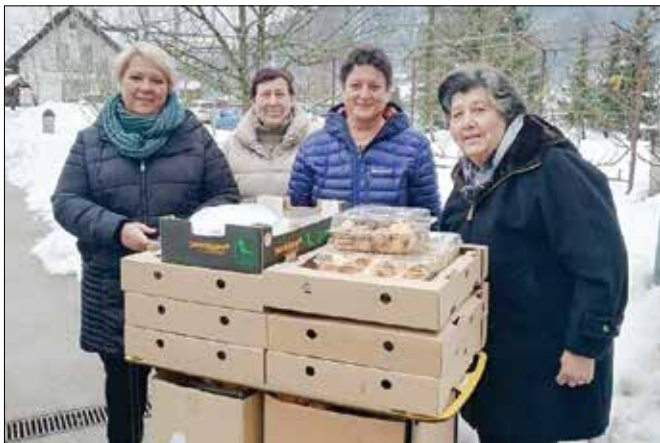
Članice društva kmetič so stanovance obdarile z domačimi dobrotami.