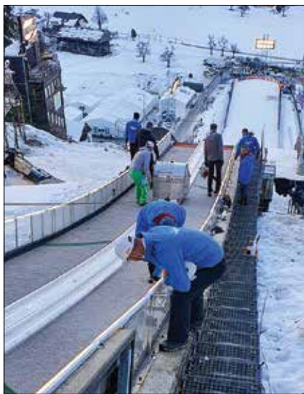
Za odlične pogoje za skoke na ljubenski skakalnici so zaslužni številni prostovoljci.