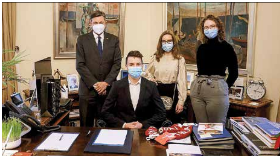
Ustvarjalci knjižne zbirke Luka bere s predsednikom države Borutom Pahorjem v njegovi pisarni