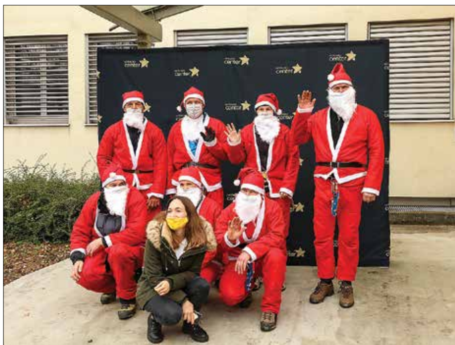
Eno najlepših jamarskih opravil je spust Božičkov, s katerim razveselijo bolne otroke v Pediatrični kliniki v Ljubljani in UKC Maribor.

Bernard je kljub številnim obveznostim oživil ljubezen do jadralskega padalstva. Za abrahamo je za darilo dobil bon za opravljanje tečaja. Trenutno je tečajnik in po letu 1993 bo še enkrat opravil izpit. Vzletišče ima tako rekoč pred domačim pragom. Ima pa Tirškov gospodar še eno veliko ljubezen, ki je že skoraj za-