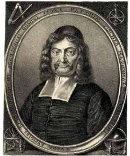
Kartograf in topograf Georg Matthäus Vischer (1628–1696)

Danes imamo na razpolago najrazličnejše zemljevide, tudi na računalniških zaslonih in na telefonih, fotografije gradov in drugih zgradb ter krajev in pokrajin, večinoma celo v barvah. Do vsega tega so naši najbolj umni predniki in sodobniki morali na kake načine šele priti. Uspešni poskusi prizadevnih posameznikov so nakazovali pot, ki je po evropski iznajdbi tiska vo-