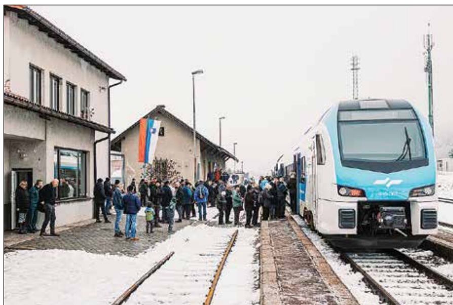
Na sodoben švicarski vlak Stadler - s temi vlaki Slovenske železnice posodobljajo svojo floto - je največ potnikov vstopilo v Šmartnem ob Paki.

no vlogo pri izvedbi slovesnosti ob tem jubileju. Vlak je kraju v zgodovini prinesel dodaten veter v jadra razvoja, saj je z njim Šmartno postalo okno v svet za celotno Zgornjo Savinjsko dolino, obenem pa ga je še bolj povežalo z industrijo Šaleške doline.