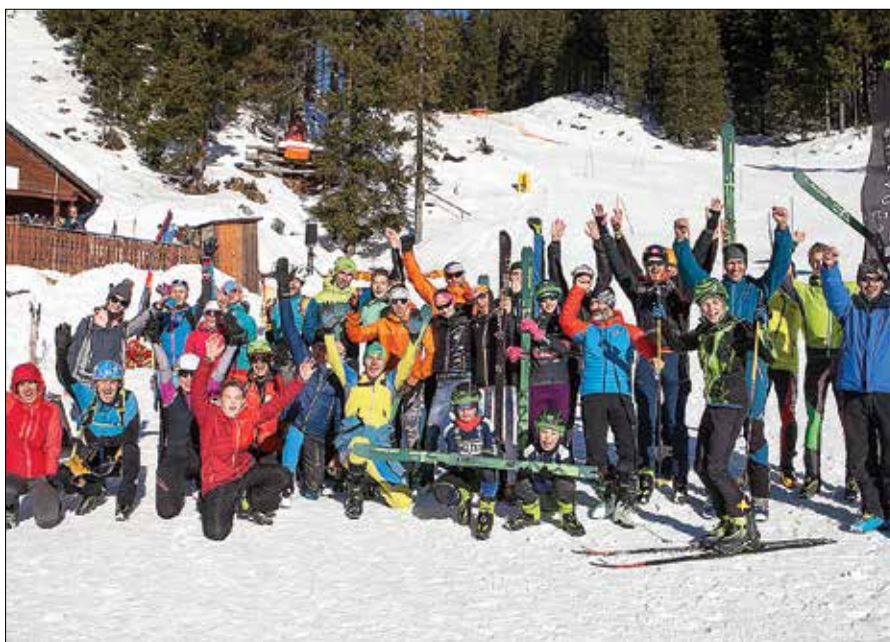
Sproščena družba udeležencev tekme