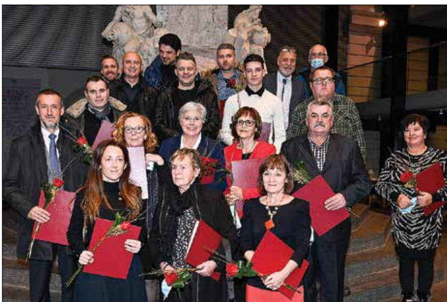
Prejemniki priznanj na zaključni prireditvi akcije Ljudje odprtih rok