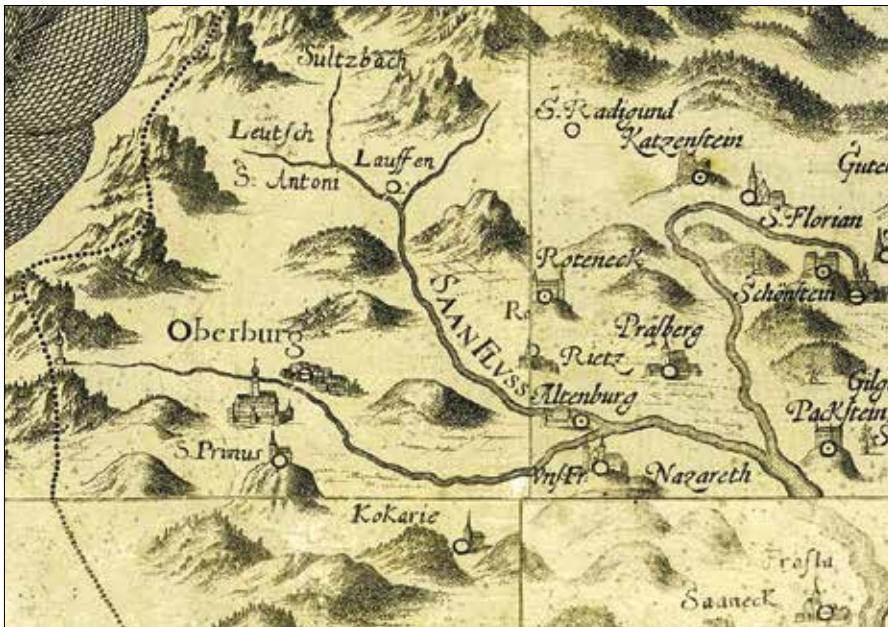
Vischerjev zemljevid Štajerske iz leta 1678: izrez z Zgornjo Savinjsko dolino

Kot zgodovinska pokrajina Štajerska, kamor spada Zgornja Savinjska dolina, v 17. stoletju ni premogla opisovalca, ki bi se ji bil pripravil in sposoben posvetiti toliko, kot se je v tistem času