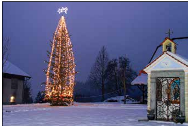
Pri Breclnu na Brezjah so mlajevci slavljencema postavili deset metrov visoko smreko.