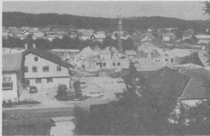
Pogled na gradbišče »Dvori«, kjer nastaja nova soseska