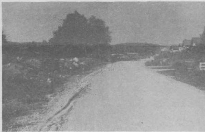
Kupi zemlje ob Grosupeljski kaziji viden novega naselja