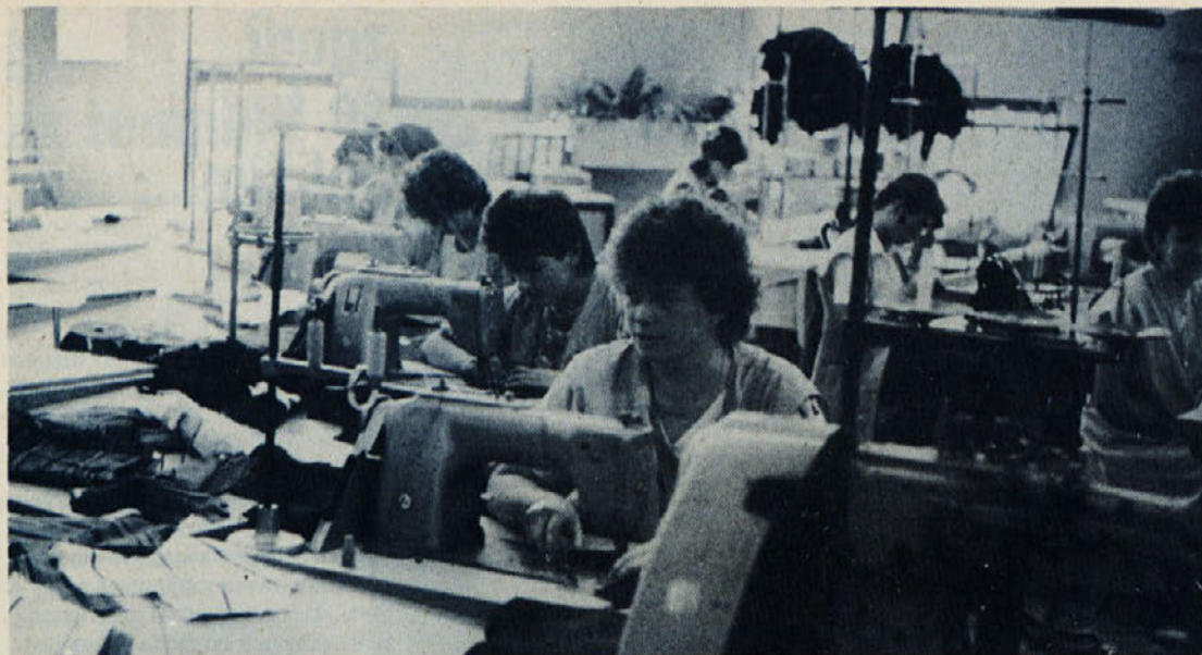
V Libni dobro skrbijo za podmladek. Na posnetku so dekleta — pripravnice in nekaj tistih s priučevanja.