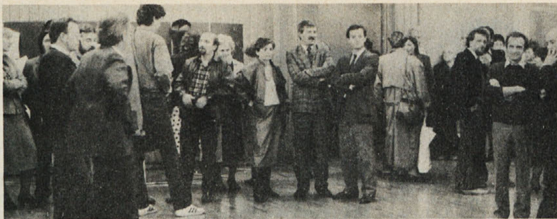
Otvoritve razstave se je udeležilo veliko ljubiteljev likovne umetnosti.