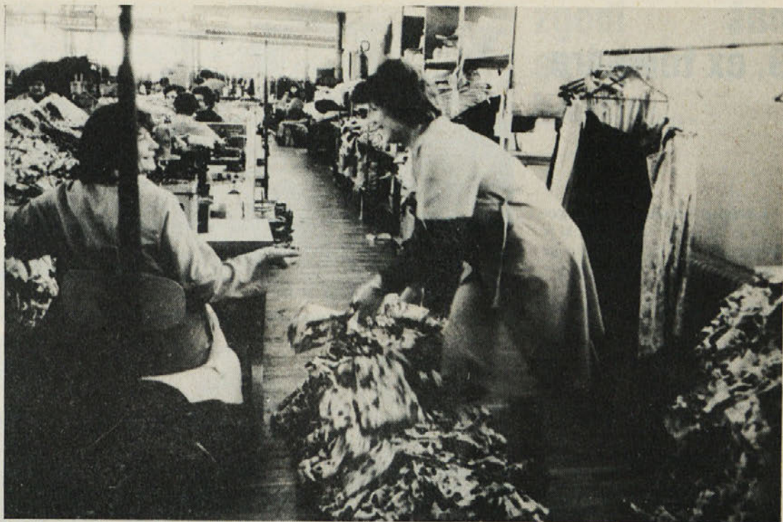
Dokler je veliko dela, je vse dobro (posnetek je iz Temenice).