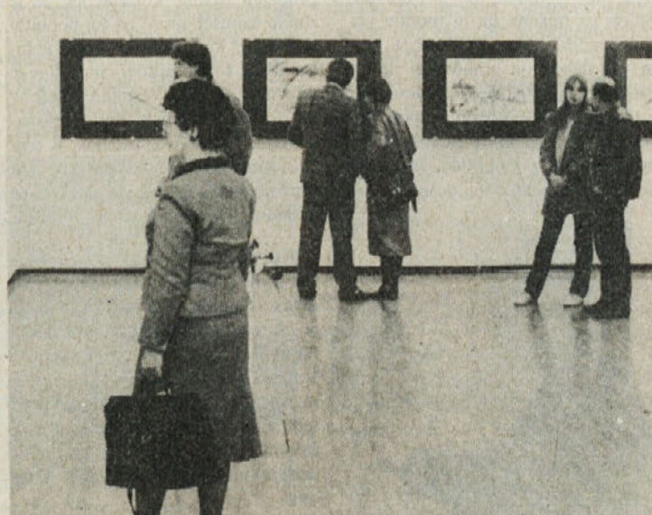
Letošnja zaključna prireditve 9. ex-tempora je bila v Dolenjski galeriji. Od tu se bo razstava preselila v Labod.