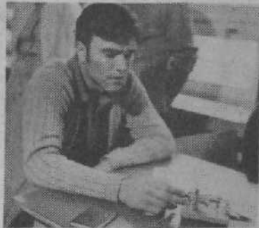
Radioamaterske organizacije so tudi v akciji NNNP dokazale, da so njihovi člani najhitrejši in najzanesljivejši obveščevalci.

Vevč in Zelene jame z dvajsetimi radijskimi postajami. Radijske zveze so bile postavljene v 15 krajevnih skupnostih. Enako bi lahko naštevali tudi akcije in aktivnosti radioamaterjev Triglava in Ljubljane, ki so z enako odgovornostjo bile vključene v akcijo v občini Bežigrad, Šiška in na Viču. Pri vsej dokaj brežhibni orga-