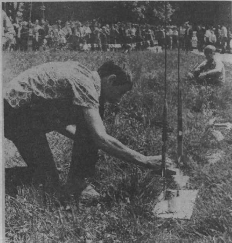
Pridobljeno znanje iz raketne tehnike bodo mladi s pridom uporabili pri obrambi domovine.

INFORMATIVNI BILTEN MK IN OK SZDL LJUBLJANE