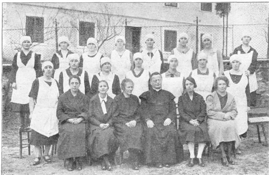
Gospodinjski tečaj v Zagorju.

Kislo smetano dobimo, ako pustimo mleko, da se zgosti, t. j. skisa in šele potem posnamemo smetano. Kisla smetana da več sirovega masla kot sladka, a nima tako pri-