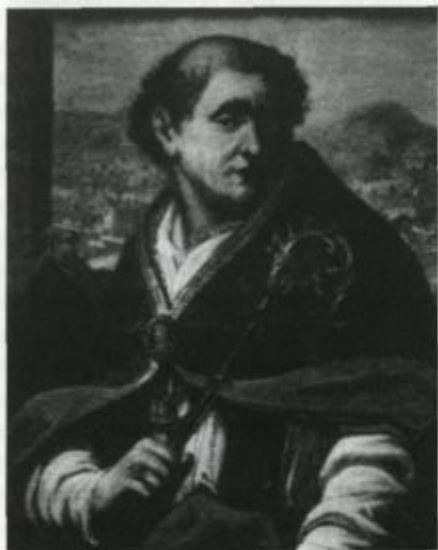
Freisingški škof Abraham

Po doslej znanih zgodovinskih virih se Abraham iz Freisinga v njih prvič pojavi sredi 10. stoletja. V novembru 955 je umrl Henrik I. (ok. 920-955), od leta 947 vojvoda Bavarske in Karantanije in od 952 tudi Veronske marke in Furlanske krajine ter mlajši brat kralja vzhodnofrankovske države Germanije Otona I. (912-973) iz rodu saških Liudolfingov. Vojvodo Henrika I. je nasledil njegov štiriletni sin Henrik II. (ok. 951-995), vendar je zaradi njegove mladoletnosti vojvodsko regentsko oblast prevzela njegova mati vojvodinja Judita, hčerka prejšnjega bavarskega vojvode Arnulfa (907-937) iz rodu Luitpoldincev. Njen svetovalec pa je postal takratni član ožjega vodstva škofije v Freisingu in njen poznejši škof Abraham. 37