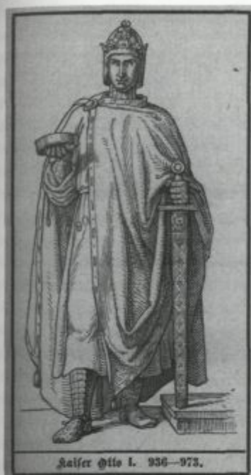
Salfer Otto I. 936–973.