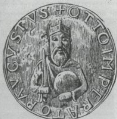
to Imperator Augustus." Kaiserfiegel Otto's des 9ten

n sich einer ebenso schweren als schwerz