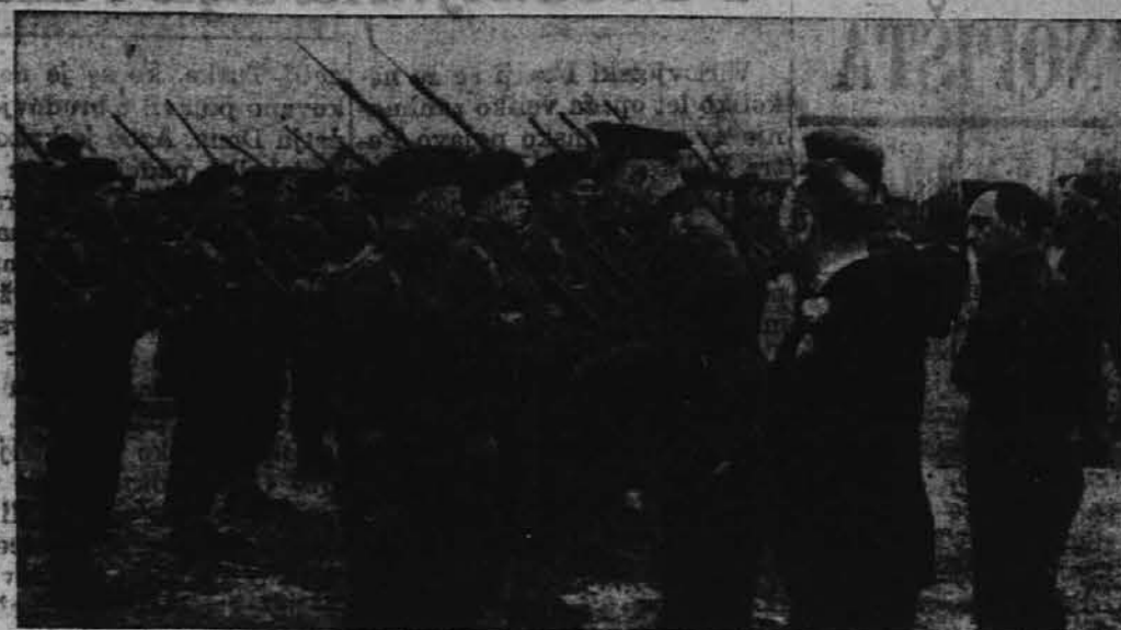
Kanadski generalni guvernier Earl of Athlone pregleduje belgijske prostovoljce, ki se v Kanadi vežbajo za vojno. Za generalnim guvernierjem je belgijski vojni minister Camille Gutt.