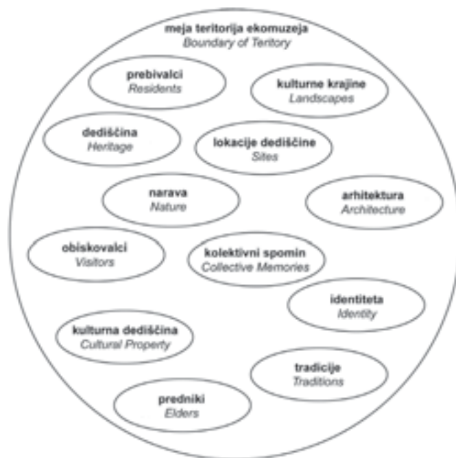
Slika 1: Grafična ponazoritev med seboj povezanih in prepletenih vsebin ekomuzeja.

Da se težave z opredeljevanjem ekomuzejev vlečejo v sodobnost, dokazuje tudi razmišljanje Hughja Spencerja, ki jih