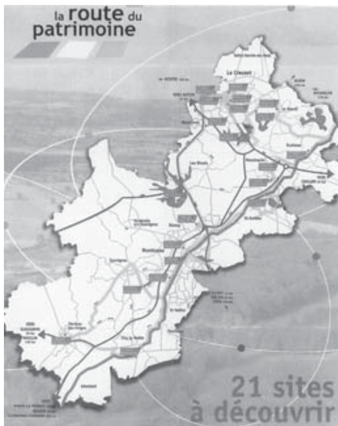
Slika 4: Poti dediščine v Ekomuzeju Creusot – Montceau. Označeno je 21 lokacij, ki predstavljajo t. i. "antene" - dislocirane enote kot "in situ" muzejske izpostave.

Tradicionalni muzej = stavba + zbirke + strokovnjaki + obiskovalci Ekomuzej = teritorij + dediščina + kolektivni spomin + prebivalci z obiskovalci