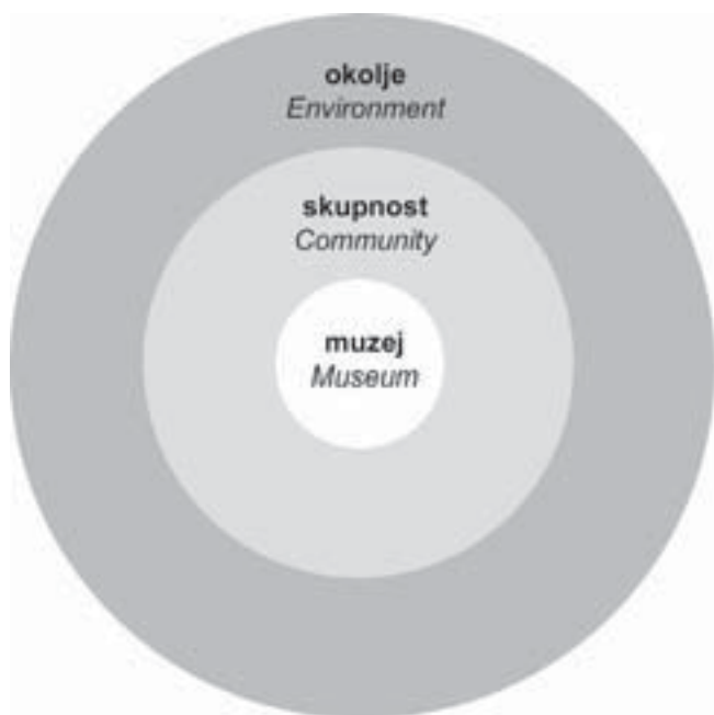
Slika 3: Ekomuzej mora biti lociran in mora delovati v okvirih lokalne skupnosti in lastnega pripadajočega okolja.

Ekomuzej so zasnovali leta 1971. Uradno "otvoritev" je doživel leta 1974. Zajemal je kar 500 km 2 veliko območje, ki je obsegalo 25 občin z več kot 150.000 prebivalci in z dvema urbanima središčema – Le Creusot (industrijsko središče) in Montceau-les-Mines (rudarsko središče). Del območja je urbanega značaja, del pa ruralnega. Osnovno vodilo ekomuzeja je bila zaščita skupne dediščine, ki naj bi bila v pretežni meri ohranjena in situ. Jedro območja muzeja je postal dvorec (Le château de la Verrerie) iz 18. stoletja, ki je pripadal družini Schneider, prav tako močno vezani na nekdanji industrijski razvoj kraja. Dvorec je postal eden vodilnih in zelo vplivnih tako imenovanih "fragmentiranih muzejev" – zbirk, ki so bile vanj prenesene in oblikovane kot nove vsebine. Sedaj dvorec deluje tudi kot osrednja informacijska točka celotnega ekomuzeja. Ocenjevali so, da je ekomuzej po petnajstih letih s svojim delovanjem uresničil večino prvotno zastavljenih ciljev