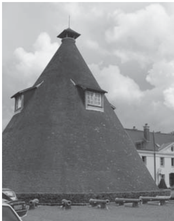
Slika 5: Dvorec Le château de la Verrerie iz 18. stoletja predstavlja izhodiščno točko ekomuzeja v mestecu Le Creusot v Burgundiji. V ospredju je stožčasta zgradba, ki služi potrebam muzejskega gledališča.

Muzej solinarstva v Sečovljah bi lahko – z nekaj prilagoditvami in dopolnitvami – promovirali tudi kot ekomuzej. Verjetno bi že samo poimenovanje povečalo njegovo razpoznavnost kot turistične destinacije in "obiskovalske atrakcije". Muzej na