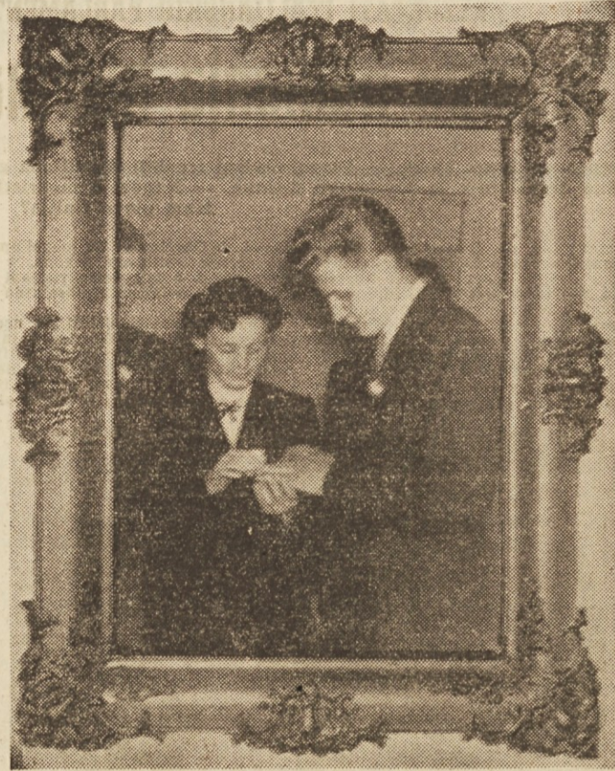
Poroka je za mladi par pomemben življenjski dogodek

Menim, da v tej smeri nismo dovolj napredovali in sem zapisal te besede v premislek zato, da bi zamujeno nadoknadili.