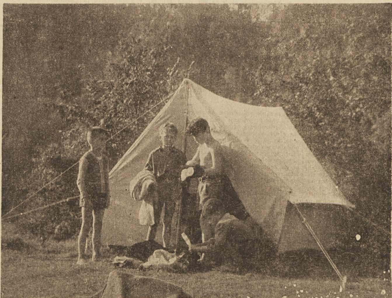
Počitnice so... Kako jih bodo preživeli naši otroci? Najlepše v naravi, na taborjenju ob jezeru, ob rekah, v planinah. Čistega zraka se bodo naučili in si ob igri pridobili novih moči, da bodo lahko v jeseni posvetili vse svoje mlade sile učenju v šoli

Vpis ljudskega posojila mesta Ljubljane dobro napreduje. Mestna hranilnica izda vsak dan več obveznic. Število vpisnikov narašča. Delavci, podjetja, ustanove, družbene organizacije in posamezniki so vplačali že precejšne zneske za gradnjo stanovanj in šol. Vedno znova pa se vplačujejo posojilo tisti, ki se še v prvih dneh in tednih vpisa niso odločili, koliko bodo prepevali. Ljubljancem se pridružujejo tudi ljudje iz drugih krajev. Zadnje tedne je Mestna hranilnica izdala več kot 20.000 obveznic. Doslej je hranilnica že izdala 90.000 obveznic, kar pomeni, da je vpisanega 45 milijonov dinarjev mestnega ljudskega posojila.