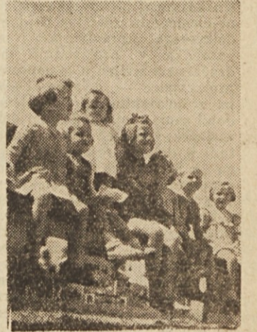
Tudi ti se vesele počitnic. V Francijo res ne bodo šli, morda pa jih bodo starši popeljali s seboj na dopust

Okrog 50 otrok iz družin naših železničarjev, katerim so padli očetje v osvobodilnem boju, pojde na počitnice v Francijo in Belgijo. Tam bodo ostali mesec dni v gosteh pri nacionalnih združenjih odporiškega gibanja francoskih, belgijskih in holandskih železničarjev. Prva skupina otrok odpotuje na počitnice že v juliju.