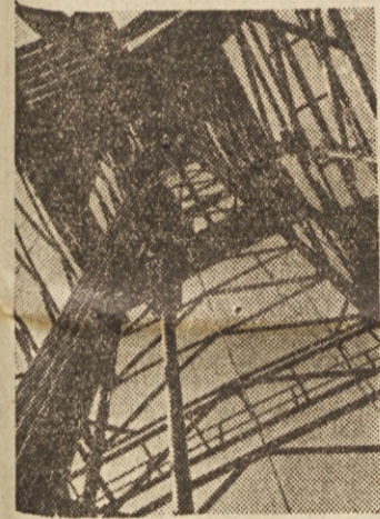
Poglejte orjaka, vrtni stroj na naših naftnih poljih.