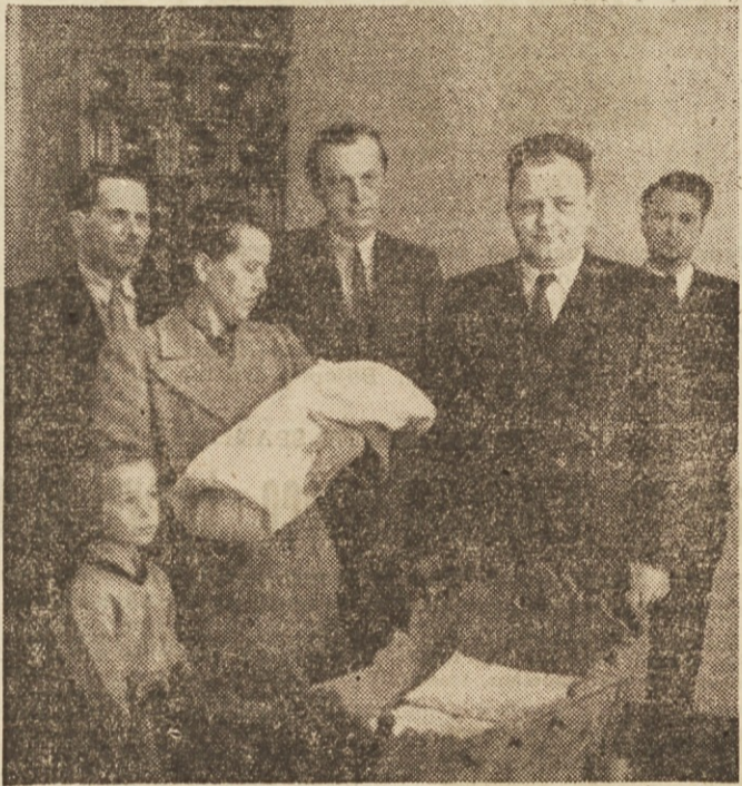
In zopet so vpisali novega državljanja v rojstno knjigo

»Narava, neskončno se ti zahvaljujem, da si me ustvarila ženo!« Tako pojejo žene z Južnih otokov v enem izmed svojih starinskih spevov