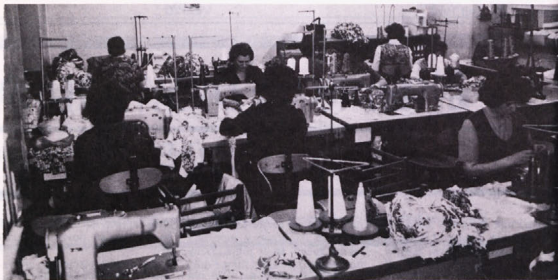
Prostori našega predstavništva v Ljubljani so zastareli, razen tega nam je lastnik stavbe odpovedal gostoljubnost; zato smo bili prisiljeni kupiti novo stavbo. Zaposleni v Ljubljani bodo tako dobili primernije prostore za delo.