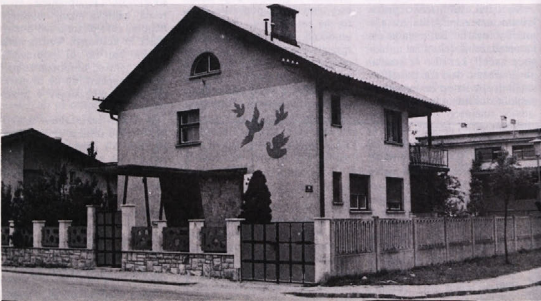
V tej stavbi bodo v Ljubljani uredili nove prostore za naše predstavništvo.