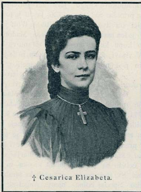
† Cesarica Elizabeta.