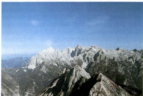
Slika 1: Pogled proti severu z Bavškega Grintavca. Desno je prelaz Vršič, v sredini Prisojnik in Razor, desno Križ, v ospredju Srebrnjak in Trentarski Pelc. Globoko spodaj je Zadnja Trenta.