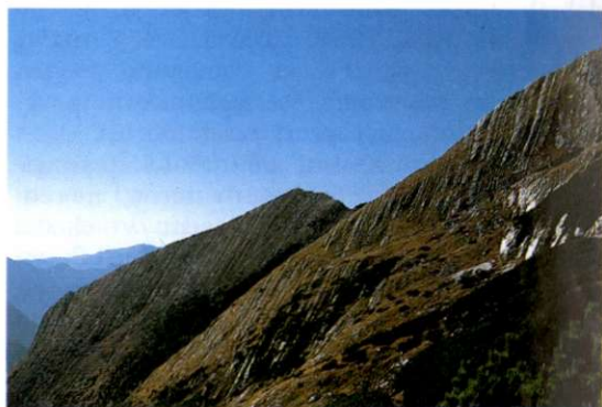
Slika 4: Značilne, od daleč razpoznavne skalnate plasti Ovčje planje in Špičice (levi vrh, 1783 m) visoko nad dolino Soče (pogled proti jugozahodu). V ozadju obriši Kobariškega Stola.