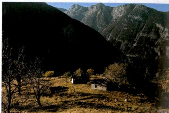
Slika 2: Zahodni del popolnoma opuščene vasi Lemovje (750 do 950 n.v.) na terasi 250 do 450 m nad dnom doline. Iz doline vodi do vasi le nekaj steza, kar danes lahko predstavlja prednost pri uvajanju t.i. ekološkega turizma.