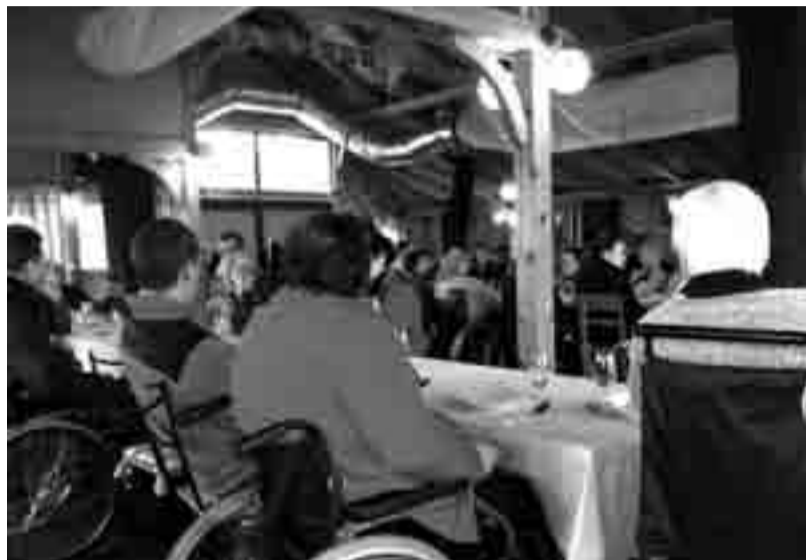
Številni člani društva na občnem zboru

Pomemben del socialnega programa je tudi program osebne asistencije. Delo petih osebnih asistentk je dokaj naporno, vendar za člane društva zelo pomembno. Zato je občni zbor na predlog UO sprejel nov pravilnik o osebni asistenci. Sprejel in potrdil