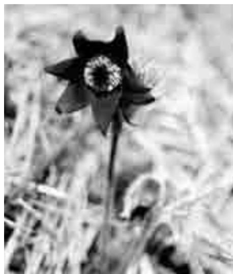
Kosmatinci so dobili ime po številnih srebrno sivih dlačicah, ki obraščajo njihovo zunanost