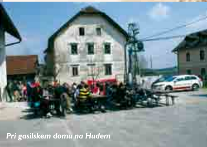
Pri gasilskem domu na Hudem