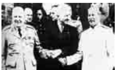
Churchill, Truman in Stalin pozirajo v Potsdamu 1945