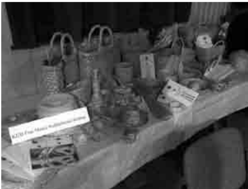
Izdelki iz pšenične slame

Naše druženje s Kulturnim društvom Krašnja se bo nadaljevalo tudi v prihodnje. Veselimo se že naslednjega srečanja, ko bo gledališka skupina Kulturnega društva Temenica z veseloigro Kokošja večerja gostovala v