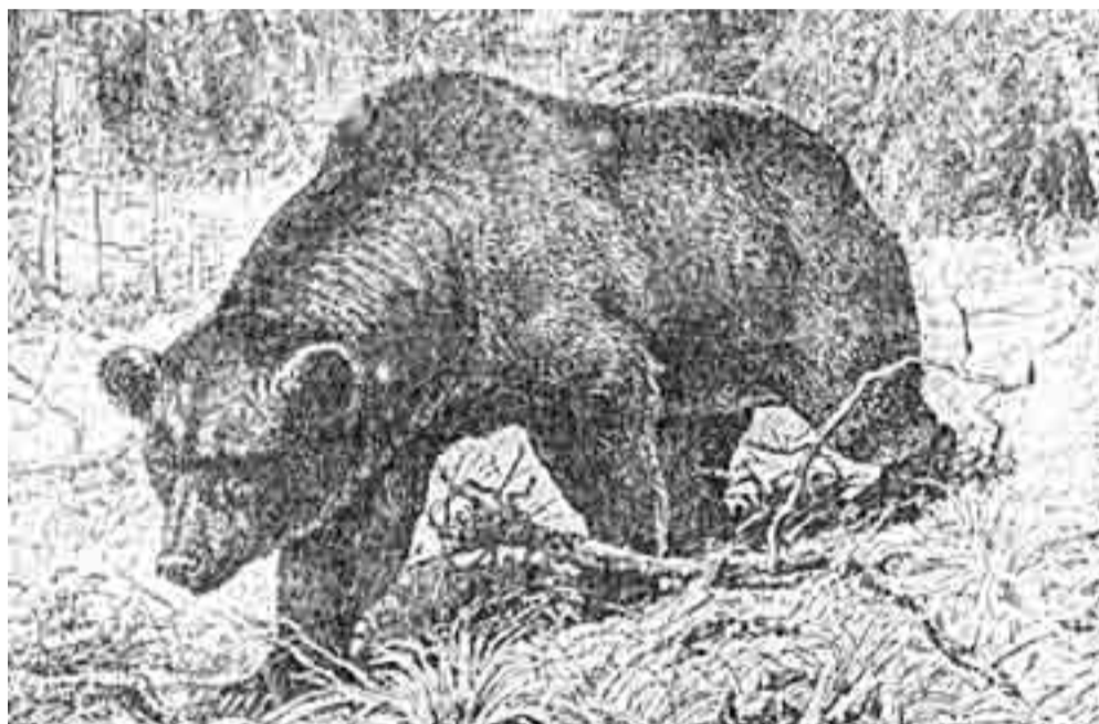
Poleg navadnega kosmatinca bi na Polževski planoti lahko srečali tudi rjavega kosmatinca, katerega s prvim nikakor ne smemo zamenjati. Obema je skupno to, da sta oba kosmata in oba zaščiteni. Zategadelj ni dobro, če se jima preveč približamo.