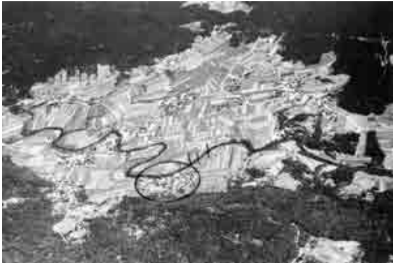
Krška dolina s ptičje perspektive. Podbukovje označeno s krogom. Tri črtice označujejo nekdanje brodove čez reko Krko.