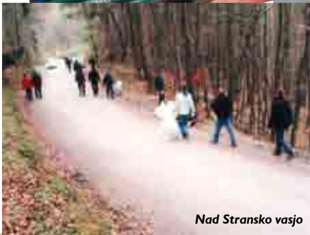
Nad Stransko vasjo