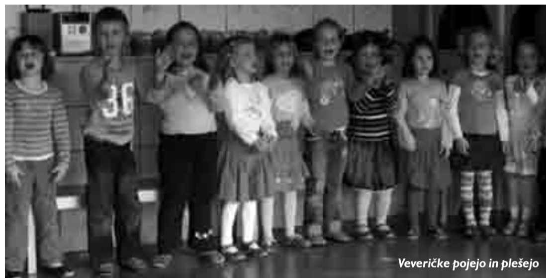
Veveričke pojejo in plešejo