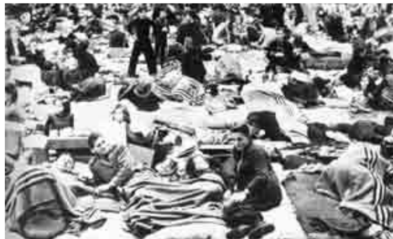
Nemško begunsko taborišče 1945