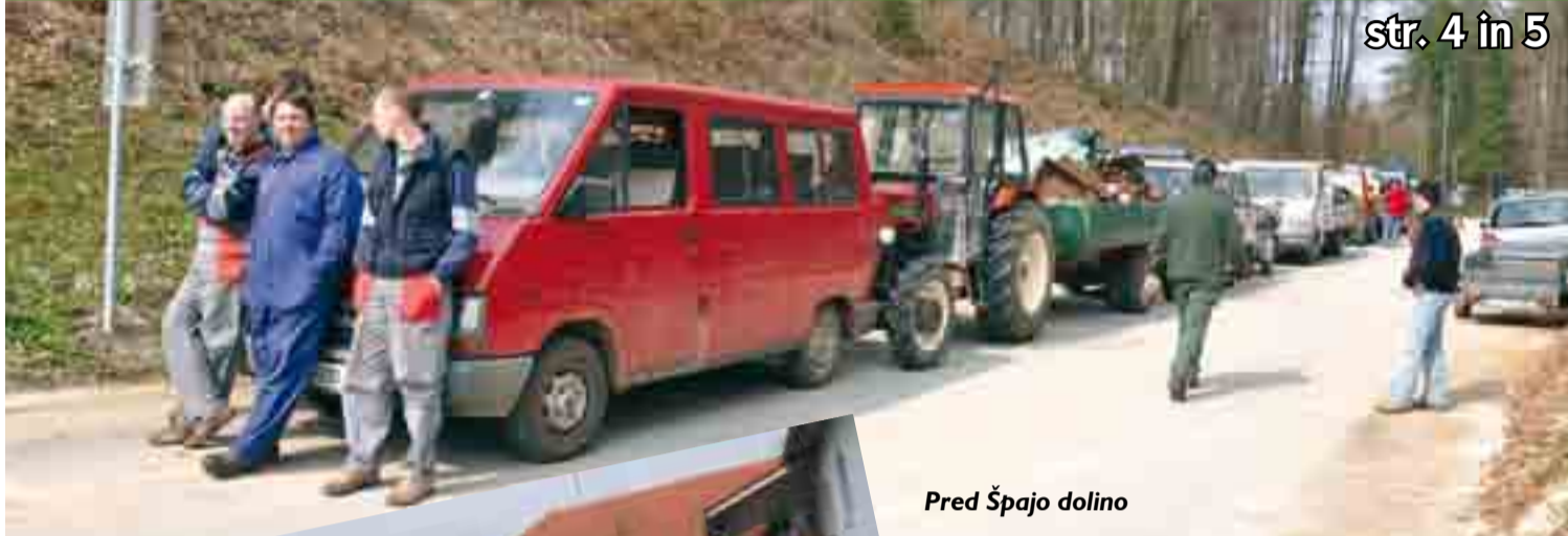
Pred Špajo dolino