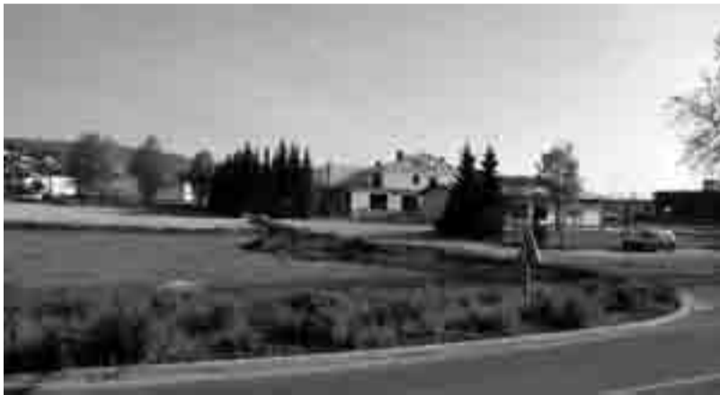
Takoj po koncu letošnje zime smo v Ivančni Gorici lahko opazili, kako je začel svojo podobo spreminjati prostor med novozgrajenim krožiščem in bencinskim servisom. V kratkem bo izginila sleherna sled za znano restavracijo Mini in modelarstvom Sever ter drugimi objekti na lokaciji bodoče Hoferjeve trgovine.

Avstrijska trgovska družba Hofer je prvih 11 prodajal v Sloveniji odprla konec leta 2005. V letu 2006 je podjetje odprlo še dodatnih 16 poslovalnic, do konca 2007 pa je število poslovalnic v Sloveniji presežilo mejo 35. Januarja 2008 je na Prevojah v občini Lukovica začela delovati centrala z logističnim centrom, ki dnevno oskrbuje poslovalnice po vsej Sloveniji. Slovenci smo t. i. »diskonterje« najprej obravnavali kot trgovine za najrevnejše sloje, v katerih naj bi bili napredaj manj kakovostni in zato poceni izdelki. Bolj renomirani slovenski trgovci so na njihov prihod na