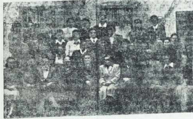
Obiskovalke prvega tečaja

Tečajnice so pokazale veliko zanimanje za predavanja, ker jim bo pridobljeno znanje dobro služilo v življenju. Pri izpitih je bilo opaziti, da so dekleta dobro dojemala snov. Razen tega, da so imele priročnike, so si pre-