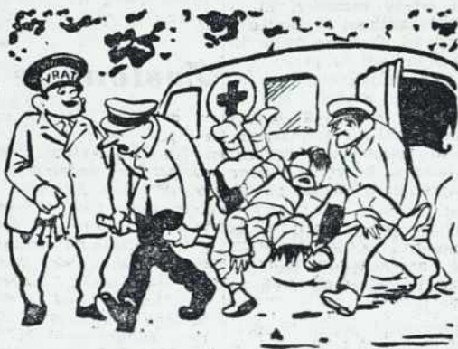
- S Koreje? - Ne, z velikonočnega streljanja.