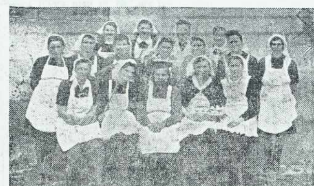
Zimski čas, ki nudi kmečkimi ženam in dekletom največ časa, da se usposablajo za dobre gospodinje, so koristno izrabile tudi žene na Hodošu. Organizirale so kuharski tečaj, katerega je obiskalo 15 žena in deklet (kakor jih vidite s svojo učiteljico na sliki).