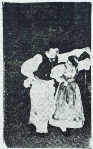
Ze ime samo pove, da bo prireditev izrazito kulturnega značaja. Prireditelji hočejo, da bi festival prikazal kulturno rast Prekmurja v zadnjih letih. Čeprav se bodo letošnji občinski prazniki, ki so jih rodile lanske letošne priprave za »Prekmurski teden«, odvijali največ po letošnjem festivalu, bo glavna prireditev v Murski Soboti širšega pomena, ne bo soboška, temveč prekmurska. Ze predvideni spored dovolj skrbi za to. Pogledjmo!

Vsi, ki so v lanskem letu obiskovali več ali manj uspele kulturne prireditve »Prekmurskega tedna«, se jih z veseljem spominjajo, obenem pa pričakujejo, kaj bo prikazal letošnji »Prekmurski festival«.