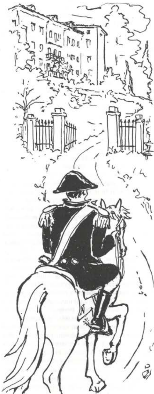
Ilustriral Jože Srebrnič