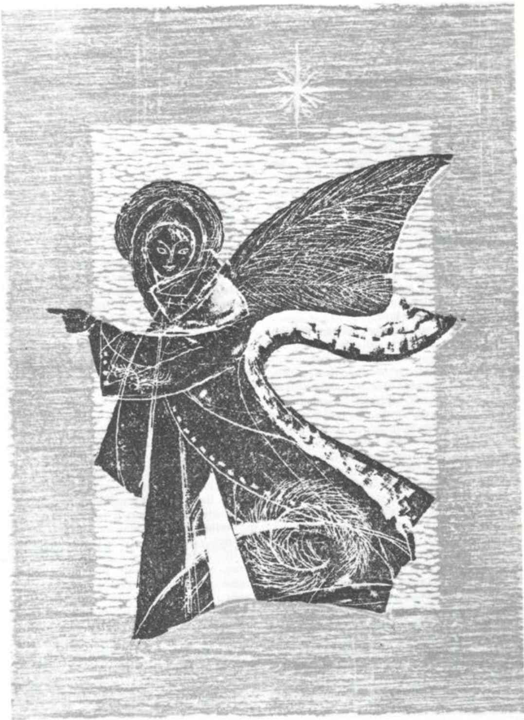
Ivan Fidler: Božična voščilnica; izvorni lesorez