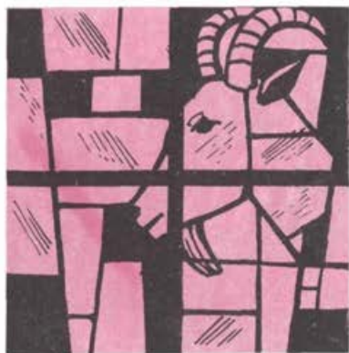
Sonca stopi v znamenje Kozoroga 22. ob 13. (začetek zime).