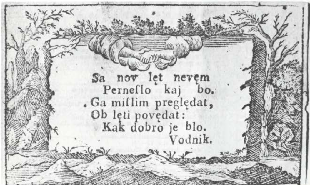
Valentin Vodnik: Sa nov let ne vem (Novoletno voščilo na posebnem listu, okoli leta 1800)