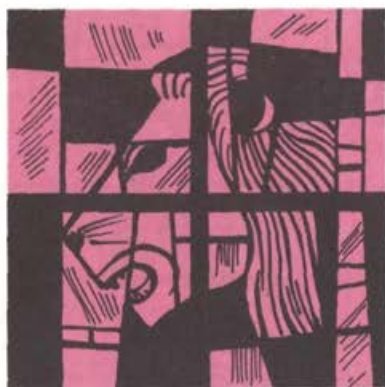
Sonce stopi v znamenje Leva 23. ob 12.