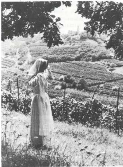
Snežanjsko dekle v vinogradu

Če briška vila si, odkrij mu tajne sile, očaraj ga, zapelji gor v snežanjski dvor, pri cerkvi šumel bo, rastel zélen bor, očaraj mu zvodnike, vse avtomobile. Ti, Bog vsevedni, saj, naj on se ti spove: bo videl v dušo mi, bo videl mi v srce.