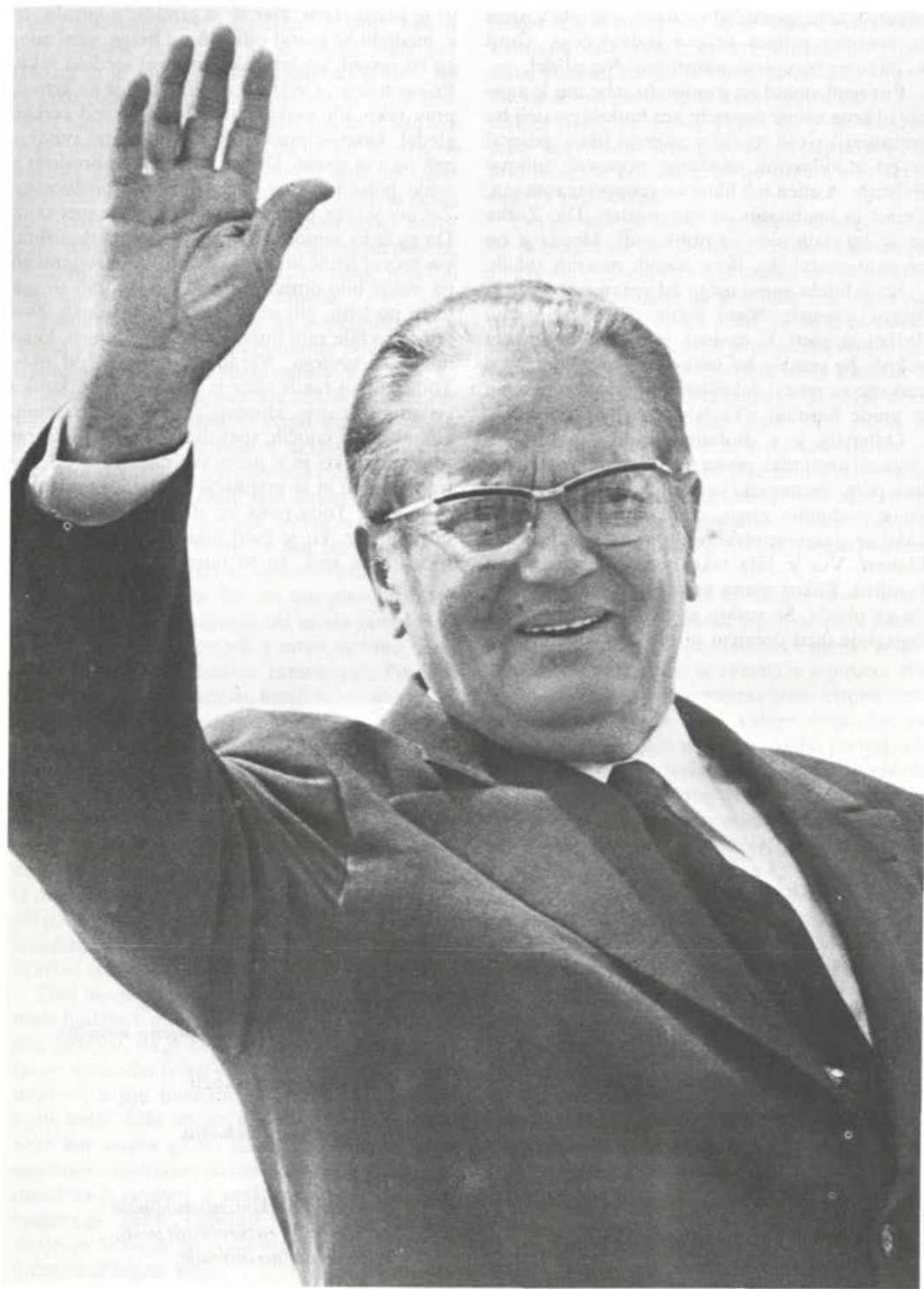
Predsednik Josip Broz Tito