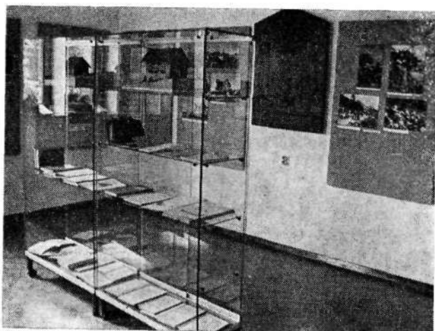
Triglavska muzejska zbirka, del razstave v četrti sobi

Pa kaj bi? Zbirka govori tako nazorno o dogajanjih in zapuščini, da jo velja obiskati in si jo ogledati.